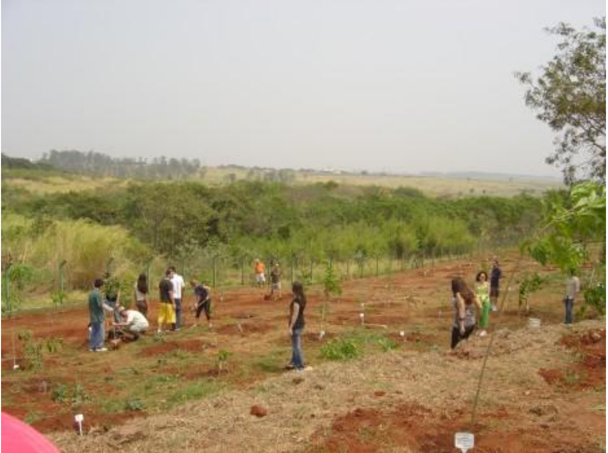
Figura 6. Funcionários do CNPM e seus familiares no dia do plantio (21/09/2007) das mudas do Bosque do Quilombo.

O dia do plantio foi 21 de setembro de 2007, em comemoração ao Dia da Árvore, e foi realizado pelos funcionários do CNPM e seus familiares. Cada um foi responsável pelo plantio de pelo menos uma muda (Figs. 6 e.7), seguindo os cuidados necessários para um bom plantio (Fig. 8), tais como: retirada e destino adequado dos sacos plásticos e tubetões, fixação, preenchimento e cobertura das covas com terra misturada a adubo e posterior irrigação das mudas recém plantadas. Cada uma das mudas recebeu uma placa simples, na qual constava, com tinta a prova de água, seu nome popular e científico.