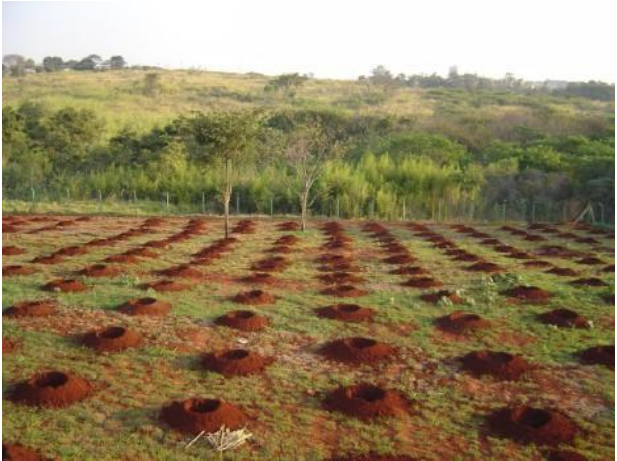
Figura 4. Covas abertas com 60 x 60 cm e em espaçamento de 3 x 3 m.

Após a abertura das covas (Fig. 4.), houve a colocação de 1 kg/cova de calcário dolomítico para correção da acidez do solo, juntamente com terra e adubo orgânico a base de 10 kg/cova, com posterior cobertura das mesmas por 90-95 dias antes do plantio. Os teores de matéria orgânica apresentados na análise de solo foram médios. Entretanto, foi utilizada uma quantidade razoável de adubo orgânico por cova visando outros benefícios ao solo que não só a fertilidade. A dosagem do adubo orgânico foi dividida em 1/3 no interior da cova e 2/3 na parte superficial do solo. O material orgânico depositado, principalmente, na camada superior da cova ajudou na retenção, drenagem da água e aeração do solo. Houve diminuição da densidade e aumento do poder tampão com contribuição a fertilização de micronutrientes e aumento do número de minhocas, insetos e microorganismos desejáveis. Assim, não houve incidência de doenças nas plantas e houve manutenção da temperatura do solo e aumento da retenção dos nutrientes.