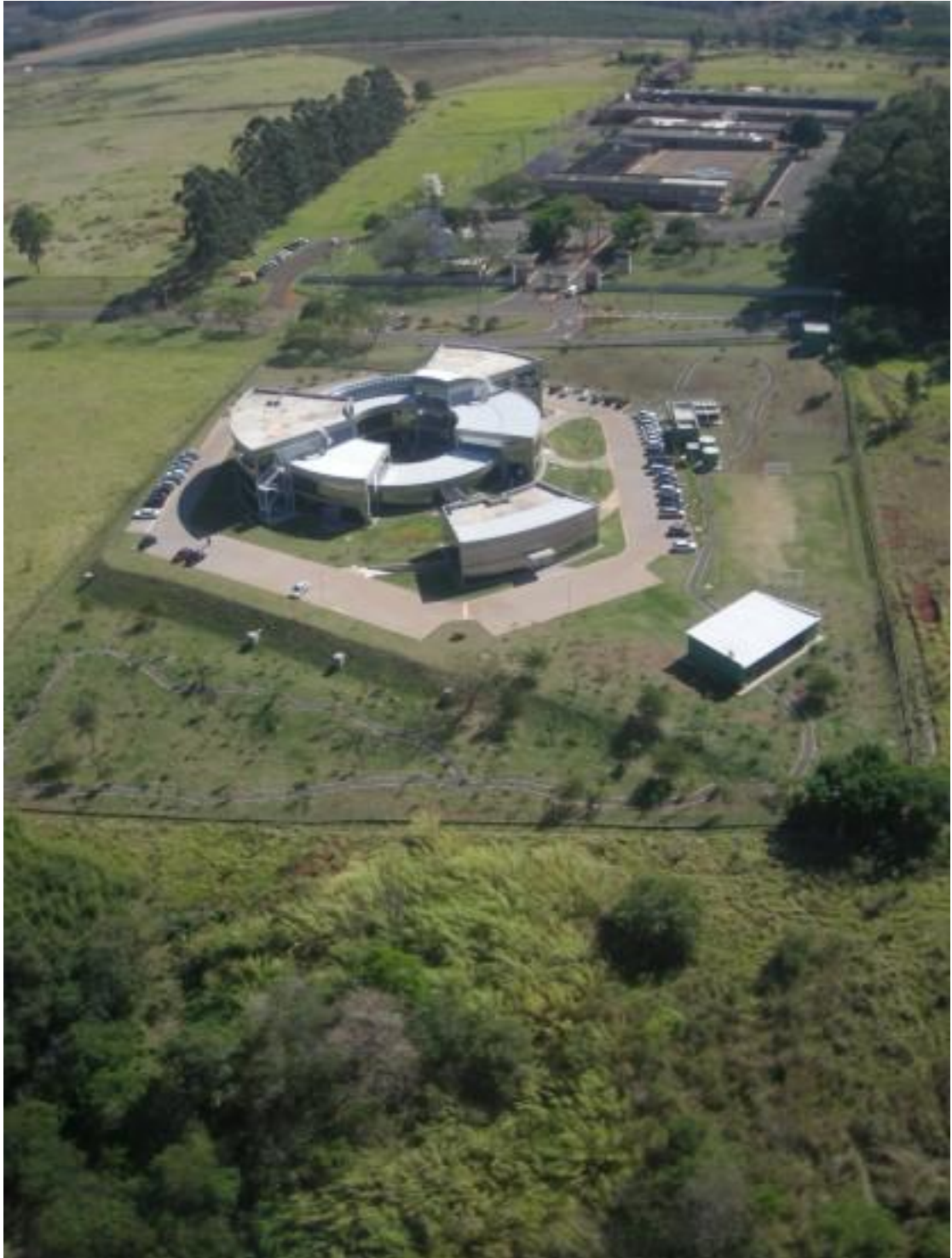
Figura 1. Vista aérea da nova sede da Embrapa Monitoramento por Satélite e da área do Bosque do Quilombo implantado em setembro de 2007.