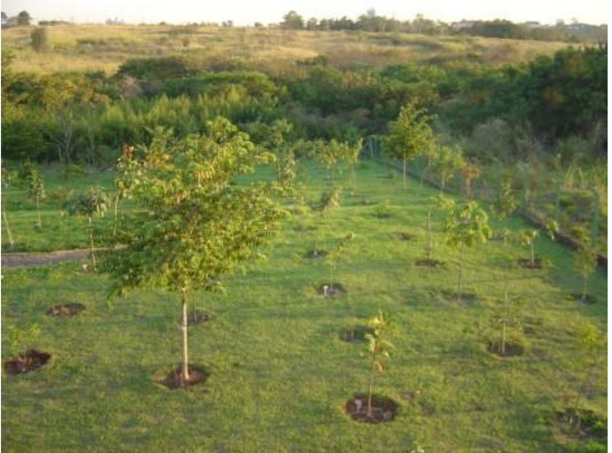
Figura 8. Bosque do Quilombo um ano após plantio (setembro de 2008) (Foto: Cristina A G Rodrigues).

Após um ano da implantação do Bosque do Quilombo (Fig. 8) observa-se que algumas espécies desenvolveram e cresceram significativamente, como indivíduos de mutambo ( Guazuma ulmifolia ), calabura ( Muntingia calabura ), guapuruvu ( Schizolobium parahyba ), paineira-rosa ( Chorisia speciosa ) (Fig. 9) e embaúba ( Cecropia pachystachia ) (Fig 10). Espécies plantadas não-pioneiras que chegam a alcançar mais de 40 m na natureza apresentaram um crescimento mais lento como o jequitibá-rosa ( Cariniana legalis ) e a peroba-rosa ( Aspidosperma cylindrocarpon ). Há no Bosque somente um indivíduo do cedro-rosa ( Cedrela fissilis ) (Fig. 11).