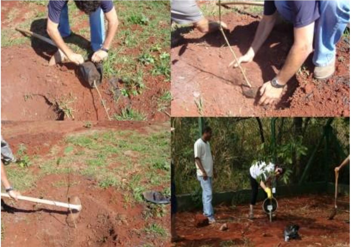
Figura 8. Cuidados tomados pelos participantes no dia do plantio (21/09/2008) do Bosque do Quilombo.