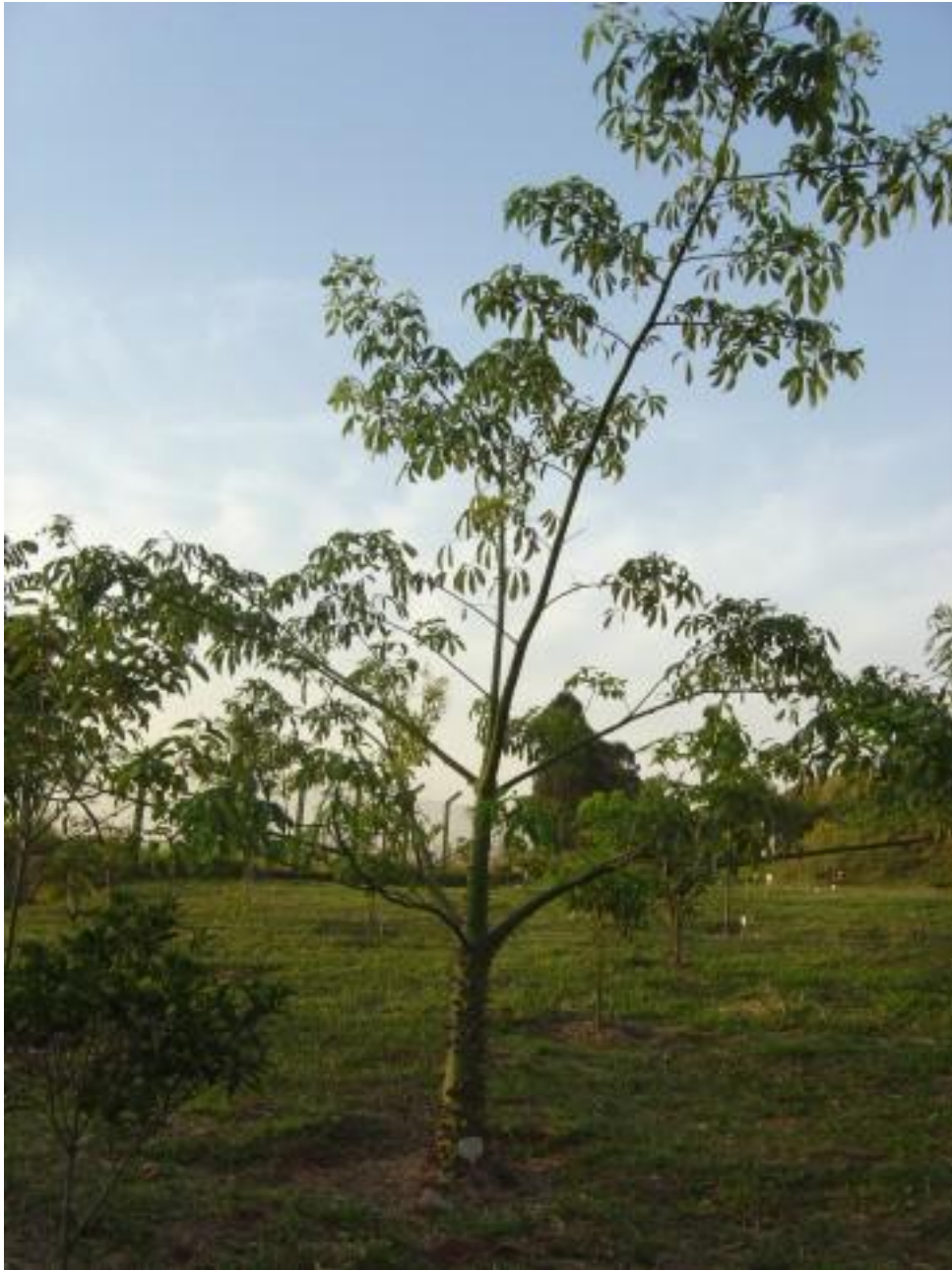
Figura 9. Paineira-rosa ( Chorisia speciosa ).