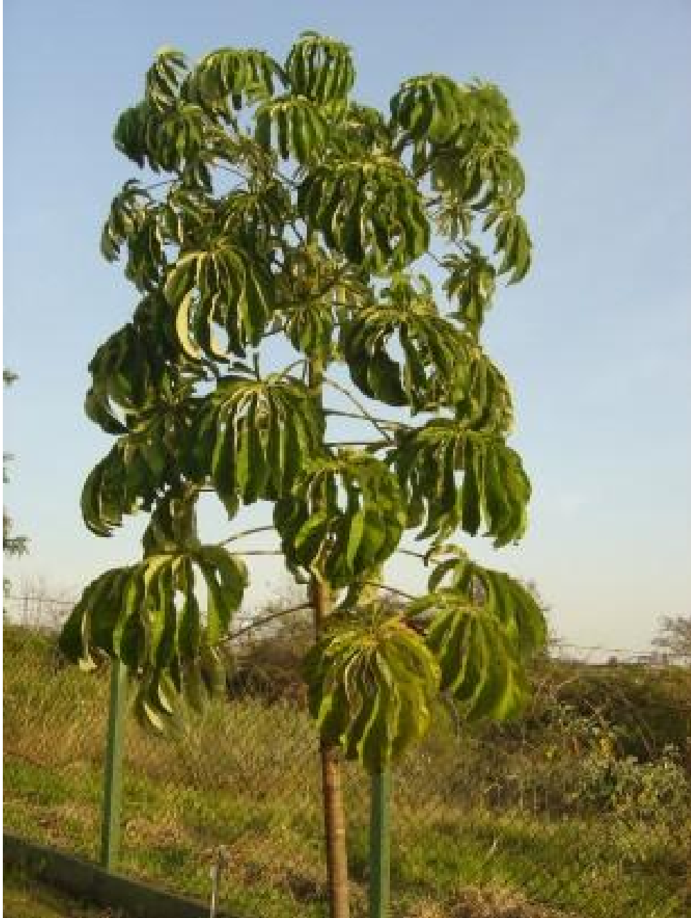
Figura 10. Indivíduo de embaúba ( Cecropia pachystachia ) do Bosque do Quilombo um ano após o plantio (setembro de 2008)..