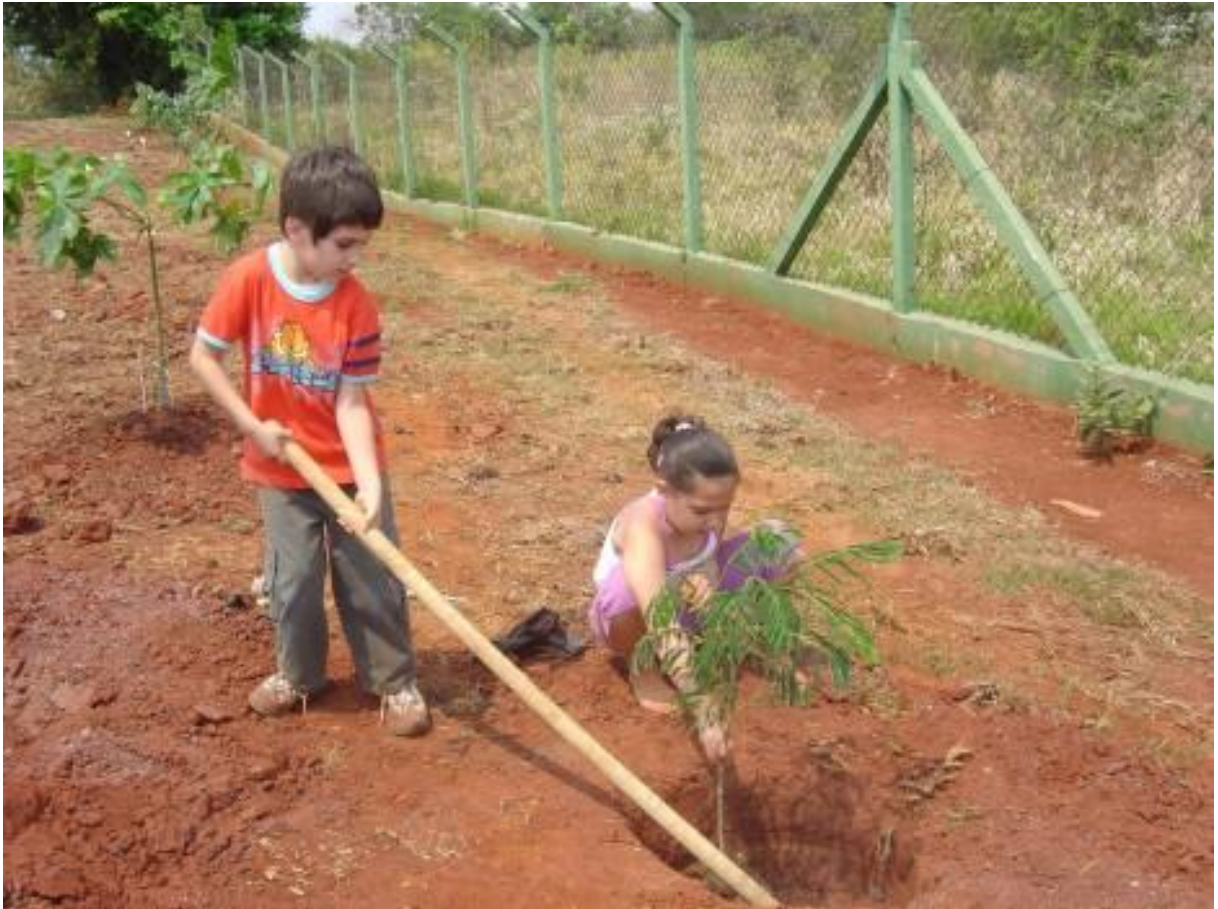
Figura 7. Crianças também participaram no plantio do Bosque do Quilombo.