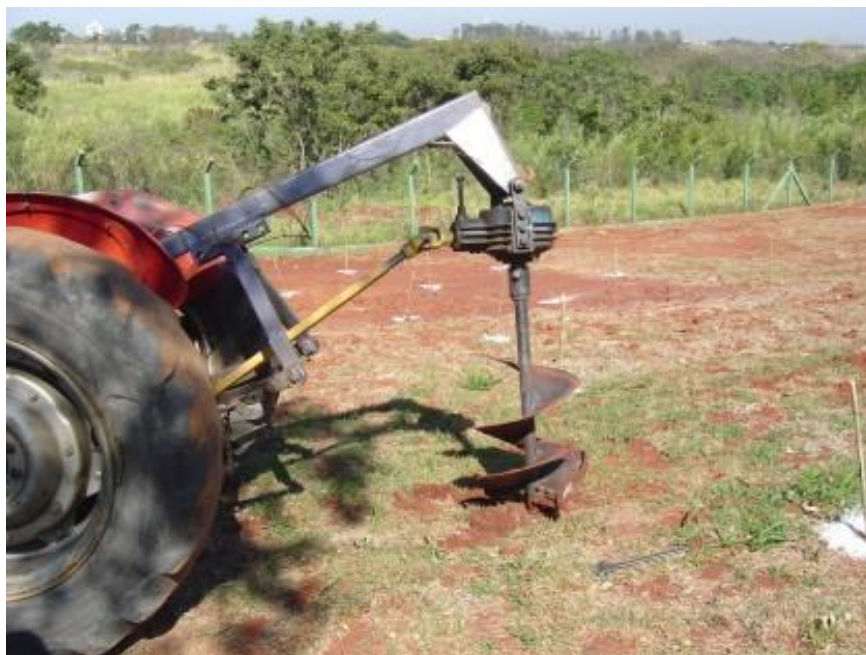
Figura 3. Perfuração das covas marcadas na área de implantação do Bosque do Quilombo

Primeiramente, foram marcados os exatos locais onde as covas seriam abertas. O espaçamento utilizado foi de 3 x 3 m, com marcação de aproximadamente 500 covas. Como a área do futuro bosque apresentava grande compactação de solo devido à movimentação de máquinas pesadas no local, foi necessário o uso de um trator acoplado a perfurador de solo para abertura das covas de 60 x 60 cm (Fig. 3)