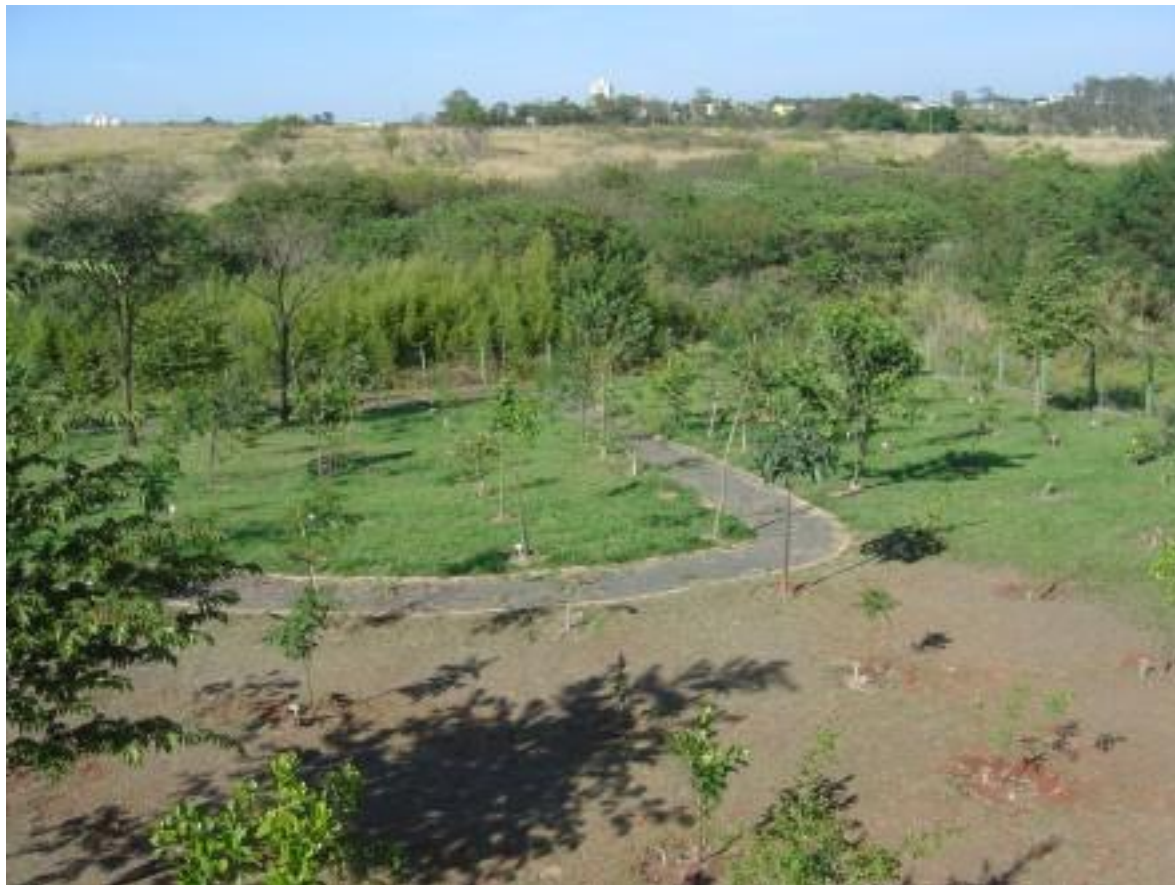
Figura 12. Bosque do Quilombo sob roçada periódica.