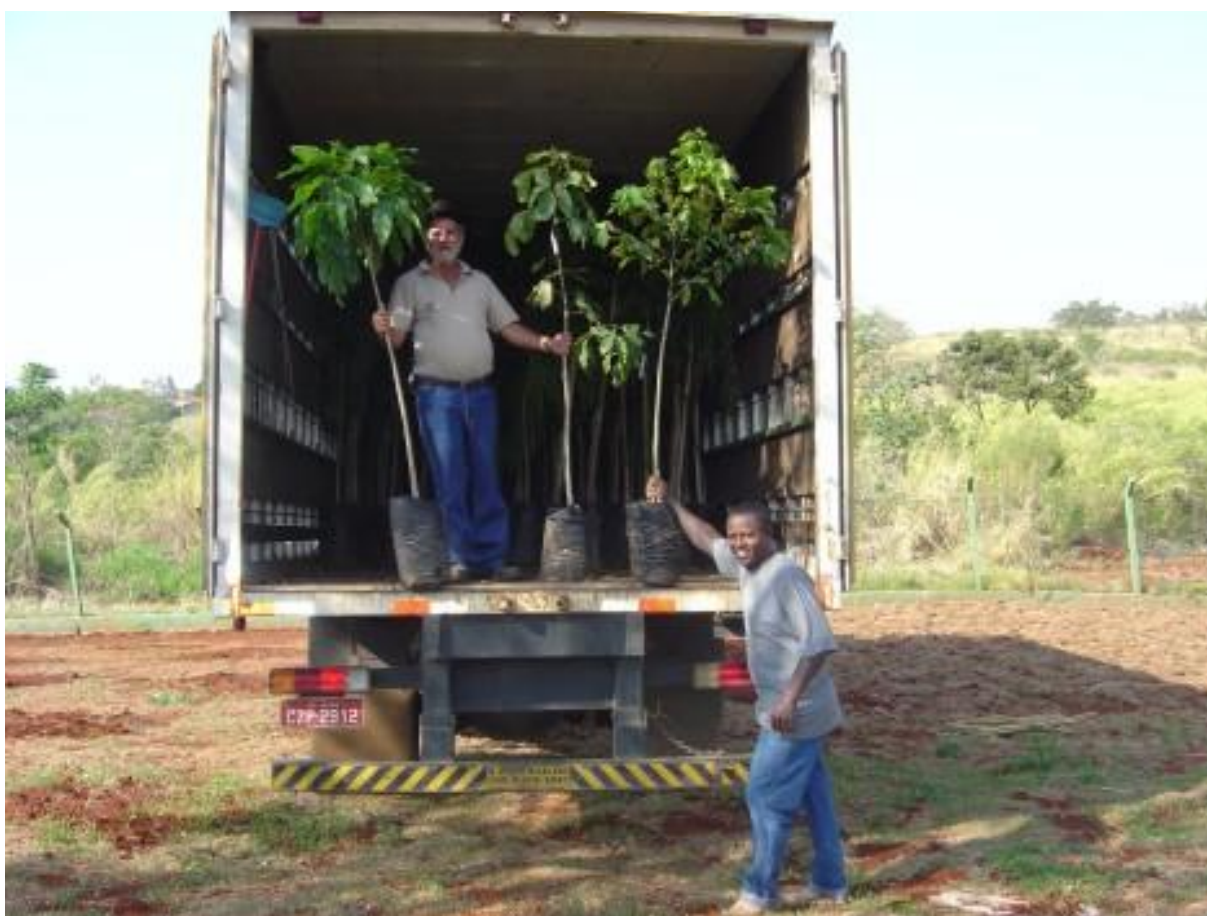
Figura 05. Transporte das mudas da origem ao local de implantação do Bosque do Quilombo.

As mudas foram recebidas 10 dias antes do plantio para acondicionamento prévio sob condições de pouca sombra, e irrigação duas vezes ao dia de início, e uma vez ao dia, poucos dias antes do plantio. As mudas das espécies apresentavam-se sob três tamanhos diferentes: mudas grandes em sacos plásticos de 20 litros (de 1 a 1,5 m), mudas em sacos de 2 litros (de 0,5 a 0,8 m) e em tubetes grandes (tubetões), e sob boas condições, protegidas da desidratação, do vento e sol em caminhão fechado (Fig. 5).