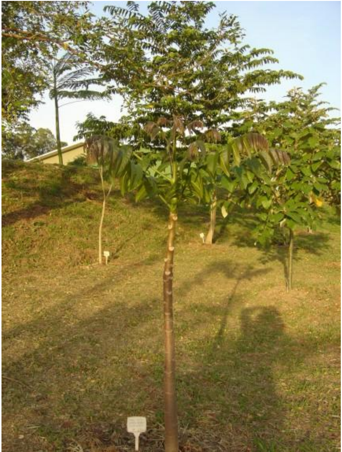
Figura 11. Único exemplar de cedro-rosa ( Cedrela fissilis ).