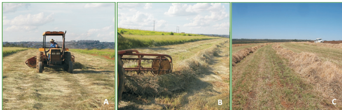
Figura 7. Enleiramento da palha.