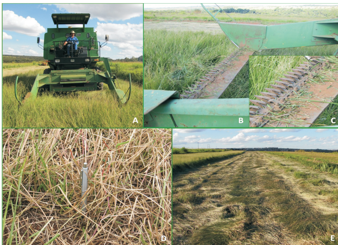
Figura 6. Corte das plantas de Brachiaria humidicola com segadeira (A); lâmina de corte e detalhe da lâmina (B e C); plantas cortadas a 20 cm do solo (D); área de produção após o corte das plantas (E).