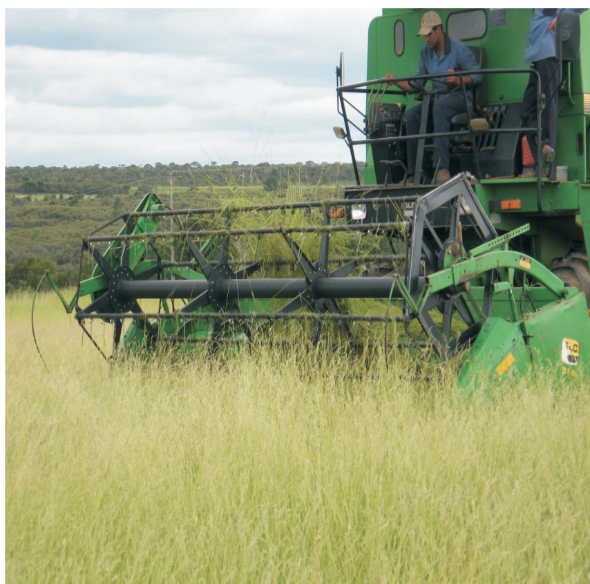
Figura 2. Colheita de Brachiaria humidicola por colhedeira auto-motriz.