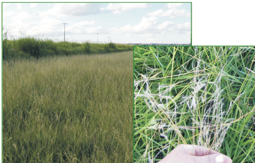
Figura 4. Área de produção de Brachiaria humidicola em ponto de colheita pelo método da sucção. No detalhe, panículas degranadas.