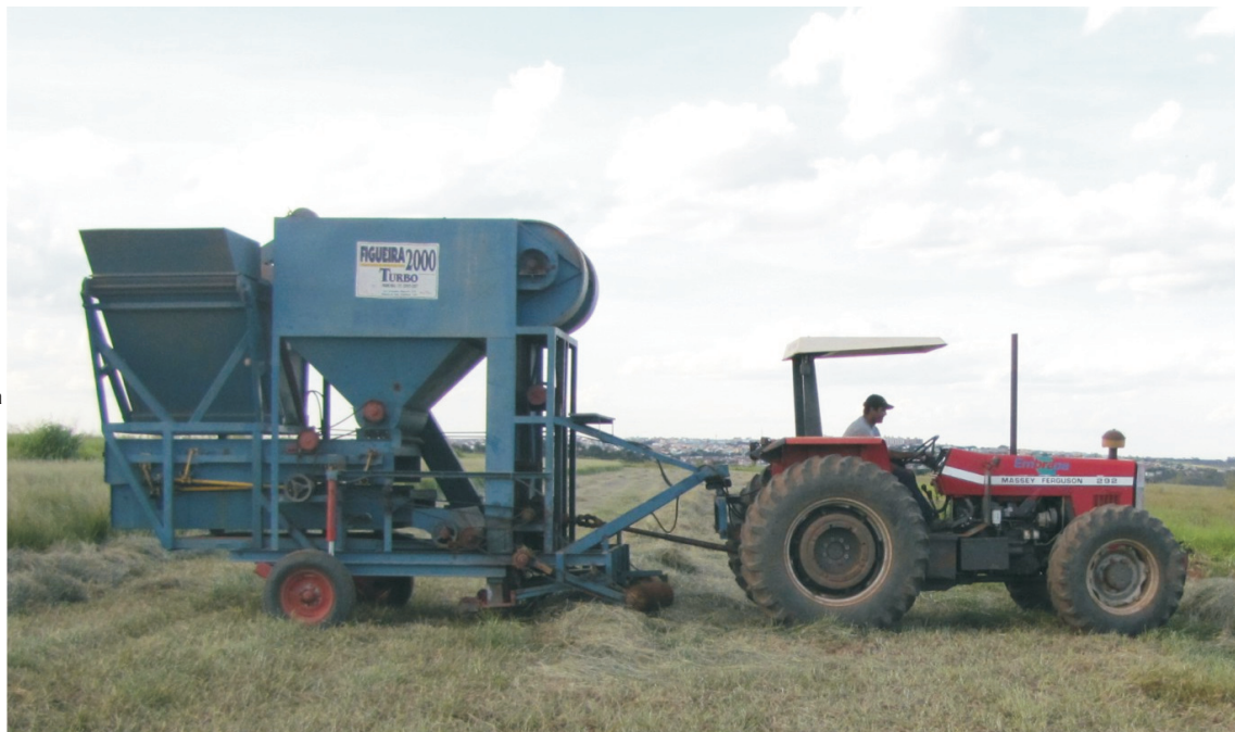
Figura 3. Máquina recolhadora de sementes para a colheita por sucção tracionada por trator.