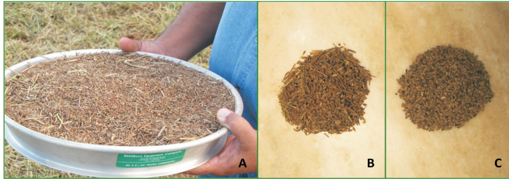
Figura 9. Sementes de Brachiaria humidicola colhidas pelo método da sucção. A e B: sementes logo após a colheita, não beneficiadas; C: sementes beneficiadas.