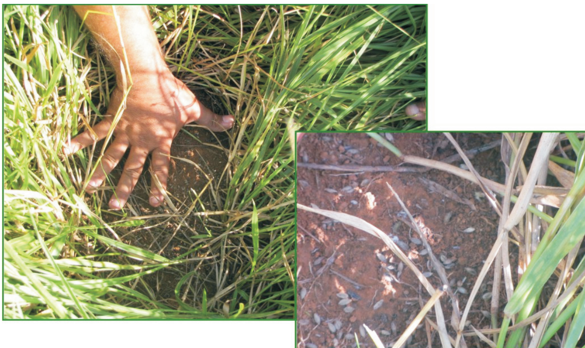
Figura 5. Plantas de Brachiaria humidicola em ponto de colheita, com espaçamento de 25 centímetros entre linhas. No detalhe, sementes na superfície do solo.