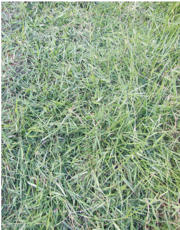
Figura 1. Plantas de Brachiaria humidicola .