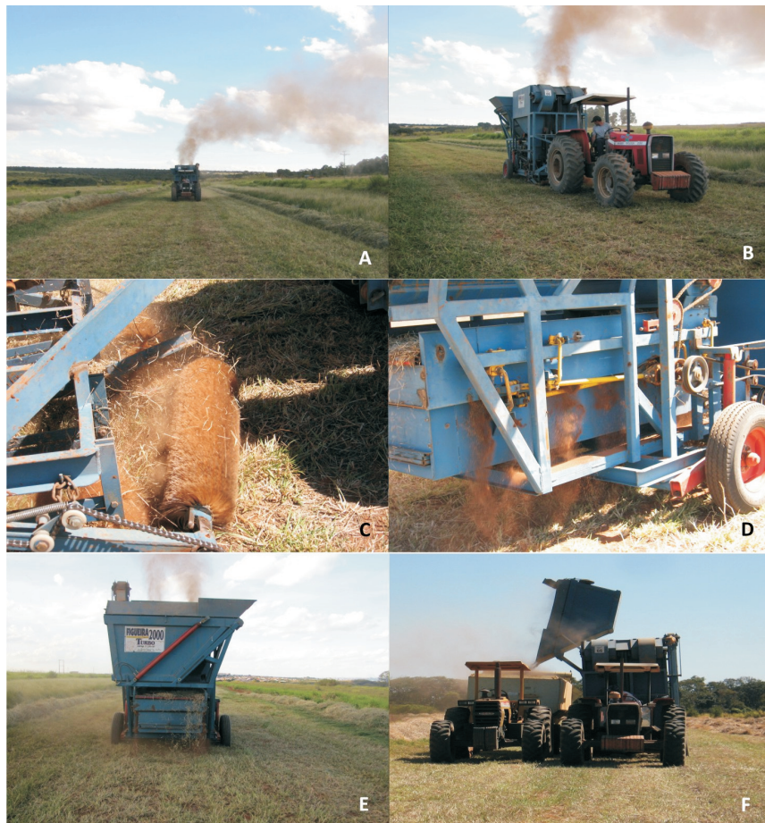
Figura 8. Colheita das sementes pela máquina colhedora recolhadora por sucção (A e B); detalhe da escova de pelos da máquina (C) e do sistema de pré-limpeza, por conjunto de peneiras (D); descarte do material resultante da pré-limpeza (E); transferência do material colhido para a caçamba (F).