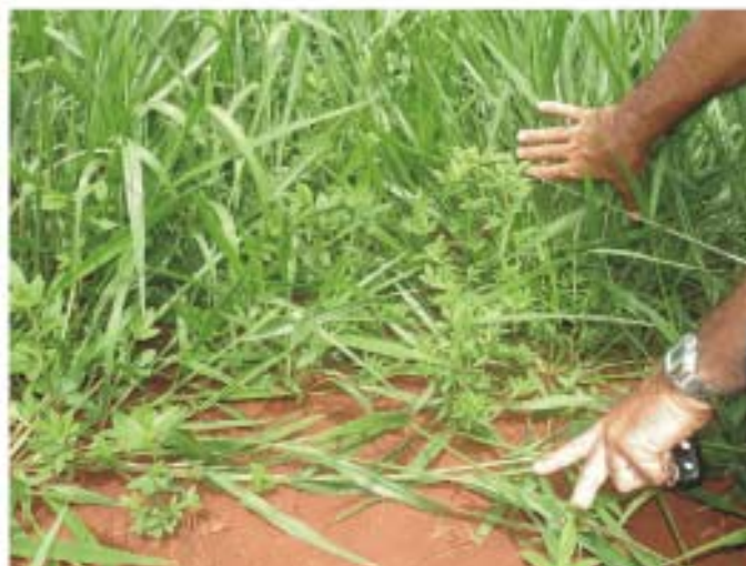
Fig. 4. Manejo de estabelecimento: ponto do primeiro pastejo.

NOTA: O manejo de estabelecimento deve ser feito OBRIGATORIAMENTE . Caso contrário, o consórcio não se estabelece.