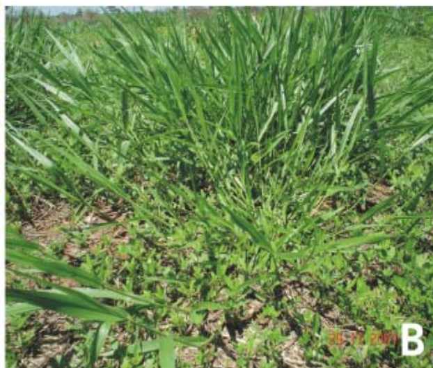
Fig. 5. Produção de sementes de estilosantes-campo-grande em pasto (A) e emergência de plântulas por meio da ressemeadura natural em pasto consorciado (B).