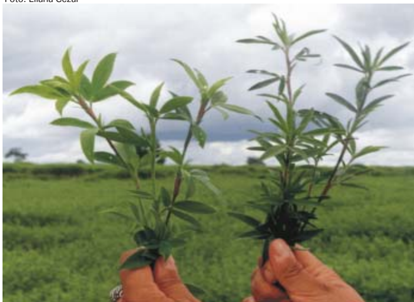
Fig. 1. Stylosanthes capitata (esquerda) e S. macrocephala (direita).