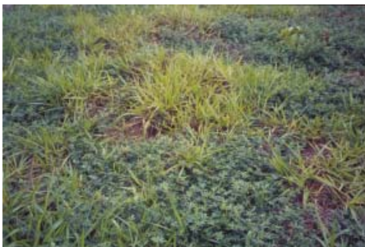
Fig. 3. Área de pastagem degradada de Brachiaria brizantha cv. Marandu com espaços vazios cobertos pelo estilosantes-campo-grande.