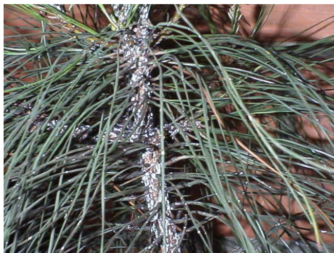
Figura 3 – Planta atacada por Pineus boernerii .