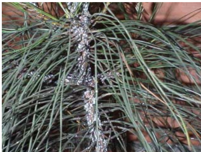
Planta atacada por Pineus boernerii .

ISSN 1517-5030 Colombo, PR Novembro, 2007