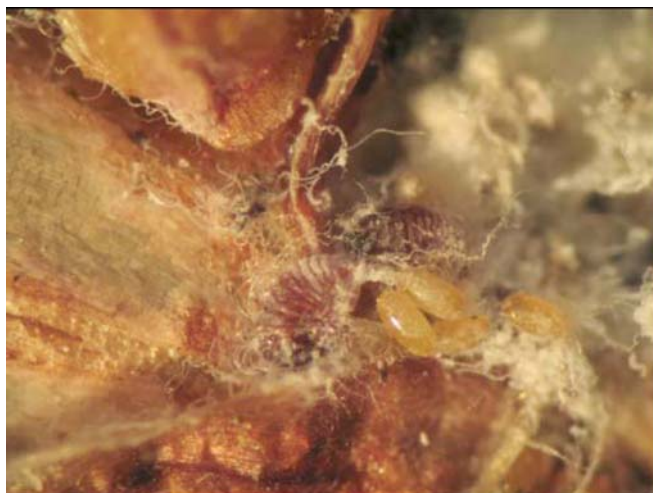
Figura 2. Ovos de Pineus boernerii .