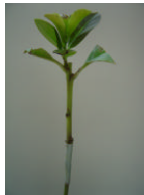
Brotação maior que 1 centímetro

Momento indicado para retirada dos enxertos da casa de vegetação