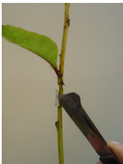
Retirada do canudinho de fixação.

h) Manejo dos minienxertos: durante toda fase de pegamento e aclimação dos minienxertos, deverão ser retiradas todas as brotações que saírem do porta-enxerto, para forçar a emissão de brotações do minienxerto, que é a parte de interesse. Após a saída dos enxertos da casa de vegetação, durante toda fase de aclimação, os minienxertos poderão receber adubações de cobertura, via água de irrigação. O canudinho de fixação deverá ser retirado quando começar a apertar muito a união, evitando que ocorra o estrangulamento do local.