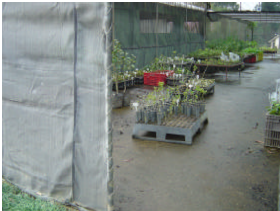
Aclimação dos minienxertos em casa de sombra

sol pleno. Já a rustificação objetiva a preparação dos minienxertos para o plantio definitivo, sendo submetidos a menores intensidades e quantidades de irrigação e ao sol pleno.