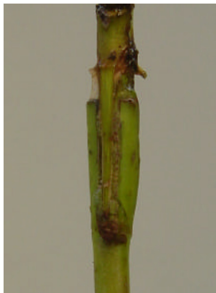
Detalhe da planta enxertada após a retirada do canudinho

h) Manejo dos minienxertos: durante toda fase de pegamento e aclimação dos minienxertos, deverão ser retiradas todas as brotações que saírem do porta-enxerto, para forçar a emissão de brotações do minienxerto, que é a parte de interesse. Após a saída dos enxertos da casa de vegetação, durante toda fase de aclimação, os minienxertos poderão receber adubações de cobertura, via água de irrigação. O canudinho de fixação deverá ser retirado quando começar a apertar muito a união, evitando que ocorra o estrangulamento do local.