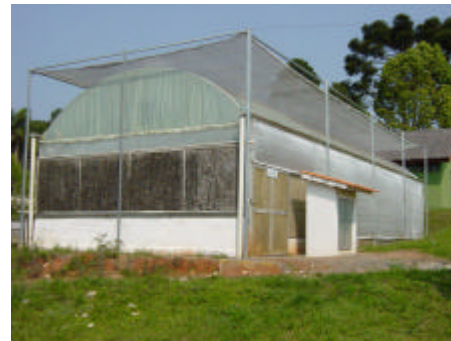
Casa de vegetação para acondicionamento dos minienxertos

f) Acondicionamento dos minienxertos: depois de realizada a minienxertia, os minienxertos deverão ser mantidos em casa de vegetação, ou seja, em ambiente com alta umidade relativa do ar. Isto é imprescindível para um bom pegamento dos enxertos, visto que nesta metodologia não é feita a câmara úmida com saco de plástico, conforme empregado na enxertia tradicional de erva-mate. Neste ambiente, os enxertos deverão permanecer até que se verifique a indução de brotações com, no mínimo, 1 cm de comprimento, e um bom calejamento da união do enxerto com o porta-enxerto.