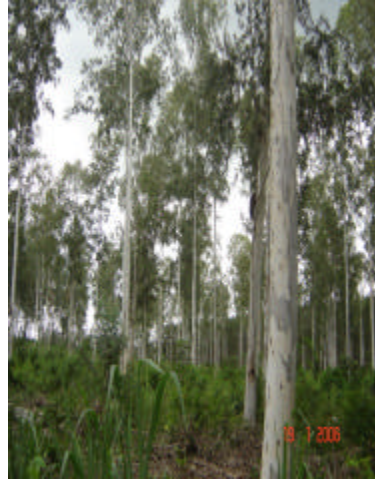
Fig. 7. População de produção de sementes de E. camaldulensis em Açailândia, MA, aos 18 anos de idade.