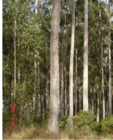
Fig. 10. Plantação comercial de Corymbia citriodora existente em Manduri, SP, aos 10 anos de idade.