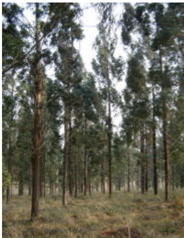
Fig. 11. População de E. badjensis em avaliação para crescimento em Ponta Grossa, PR, aos 7,5 anos de idade.