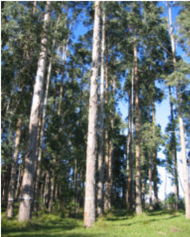
Fig. 4. Matrizes de E. benthamii em Área de Coleta de Sementes com Matrizes Marcadas (ACS-AM) em Colombo, PR, aos 17 anos de idade.

As sementes apresentam tamanho reduzido, perfazendo entre 450 e 800 mil sementes por quilograma, o que possibilita formar cerca de 80 a 130 mil mudas. A constatação que a capacidade de rebrota é alta, podendo ser acima de 80% (GRAÇA et al., 1999), indica que as mudas podem também ser formadas por clonagem.