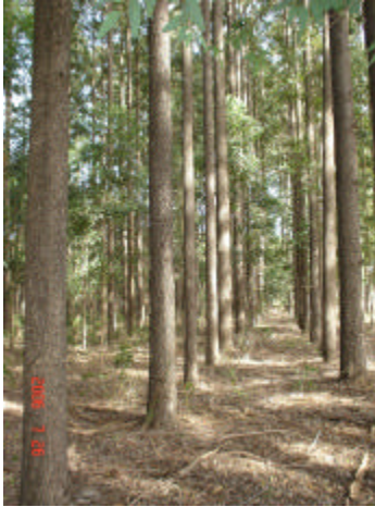
Fig. 9. Plantação comercial de Eucalyptus cloeziana existente em Manduri, SP, aos 26 anos de idade.