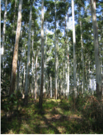
Fig. 8. População desbastada de E. grandis em Barra do Ribeiro, RS, aos 18 anos de idade.