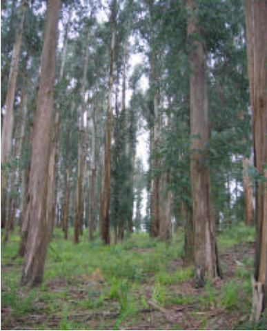
Fig. 6. População de E. viminalis manejada para produção de sementes em Catanduvas, SC, aos 19 anos de idade.