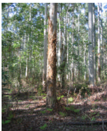
Fig. 5. População desbastada de E. saligna em Eldorado do Sul, RS, aos 18 anos de idade.

A Embrapa Florestas , em parceria com o Instituto Florestal de São Paulo (IFSP), vem trabalhando na seleção para qualidade de madeira e enraizamento, com vistas à clonagem de árvores selecionadas em testes de progênies e procedências. Sementes de E. saligna são facilmente encontradas no mercado, sob diversos graus de melhoramento. As sementes apresentam tamanho médio, perfazendo aproximadamente 460 mil por quilograma, com possibilidade de se formarem cerca de 75 mil mudas. As mudas podem também ser formadas por clonagem, uma vez que a capacidade de rebrota e de enraizamento são de modo geral altas, porém, sempre dependentes da capacidade intrínseca do genótipo para esse sistema de multiplicação.