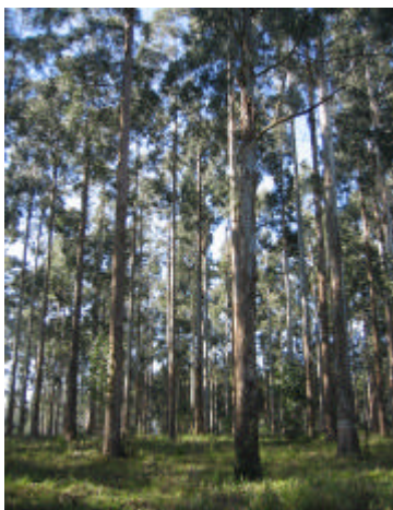
Fig. 3. Área de Coleta de Sementes com Matrizes Seleccionadas por caracteres fenotípicos (ACS-MS) de E. dunnii em Colombo, PR, aos 26 anos de idade.

Em Colombo, PR, a Embrapa Florestas vem conduzindo uma população de primeira geração de seleção oriunda de teste de procedências plantado em fevereiro de 1979. A Área de Coleta de Sementes com Matrizes Seleccionadas por caracteres fenotípicos (ACS-MS) descende das procedências geográficas Urbenville (altitude 350 m), Moleton (altitude 430 m) e Dorrigo (altitude 700m). A população (Figura 3) produz frutos de forma não-prolífica e irregular, provavelmente pelo fato da temperatura média anual da região (17°C) ser maior que a ideal para a reprodução da espécie, que seria de 16°C ou menos (ARNOLD & DONGYUN, 2003). Foram colhidas sementes de 60 matrizes dessa área e, em 1994, instalaram-se testes de progênies de polinização aberta de segunda geração em Ponta Grossa, PR. A partir de sementes do mesmo lote, foram instalados, em 2003, ensaios semelhantes em Bagé e Carazinho, municípios localizados no Rio Grande do Sul. Comercialmente, a produtividade média de sementes das 142 árvores (84 m 2 de área por árvore) da ACS-MS aos 20 anos de idade foi de 625 g, com poda de 50% da copa (HIGA et al., 2001).