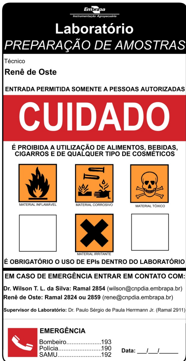
Fig. 2. Cartaz de Segurança do Laboratório de Preparação de Amostras.

Quando o programa associado a cada equipamento é acionado, uma janela do software é aberta para acesso ao sistema com nome e senha de cadastro. Após o acesso inicial, é solicitado ao usuário que descreva sucintamente as análises que pretende fazer. Ao término das análises uma janela é aberta onde é interrogado ao usuário se ocorreu algum problema no decorrer dos processos de medições. Em caso positivo, uma segunda janela se abrirá com um campo onde o usuário poderá descrever o problema apresentado. Assim, além do controle, o programa permite um acompanhamento de eventuais problemas técnicos, sendo possível também rastrear o número de usuários e tempo de uso. Essas informações mostram a demanda de uso de cada equipamento, auxiliando na tomada de decisões para compra de materiais de consumo e na sua manutenção.