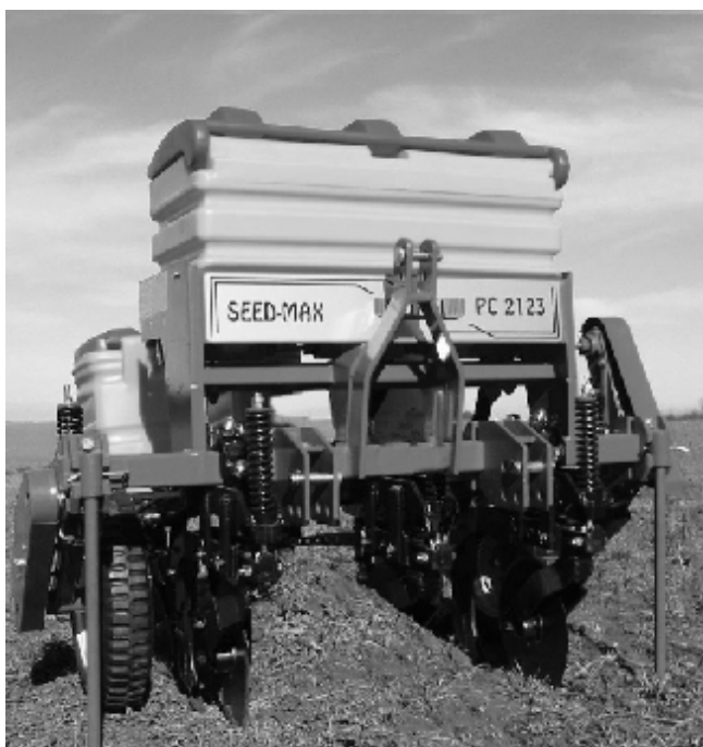
Fig. 2 Semeadora e adubadora utilizada no experimento.

Antes de iniciar os ensaios, realizou-se a caracterização física do solo, determinando-se fatores como granulometria, densidade do solo, densidade de partículas, porosidade total, teor de água (EMBRAPA, 1997) e resistência do solo à penetração (ASAE, 1990).