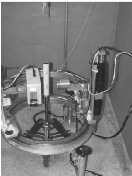
Fig. 3 - Vista geral do tomógrafo utilizado para determinação das densidades do solo na região da semente.

Para determinar as densidades do solo na região da semente, utilizou-se um tomógrafo de terceira geração (NAIME, 2001), constituído de um sistema fonte-detector posicionado em uma guia circular, que realiza movimentos de rotação ao redor da amostra. Utilizaram-se uma fonte de raios gama ( ^{241}\text{Am} , E = 59,54 keV, 1,11 \times 10^9 Bq) e um arranjo de 256 detectores composto de material semicondutor. Os movimentos de elevação e rotação foram executados por dois motores de passo, controlados por um sistema eletrônico baseado no computador dedicado à eletrônica embarcada padrão PC/104 (Fig. 3).