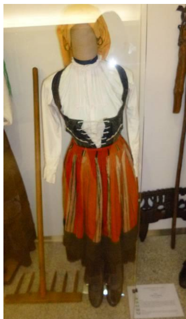
Figura 4. Traje de Trabalho Rural ou de Uso Comum.

Numa primeira análise, pode-se constatar que a globalidade dos trajes dos dançarinos do Grupo Folclórico de Vila Verde apresenta simetria de reflexão de eixo vertical (Crowe, 2004). Contudo, existem exceções que de forma deliberada rompem com a simetria. Para corroborar o disposto, apresentam-se, doravante, alguns exemplos. A camisa de linho pertencente ao Traje masculino de Encosta, Festa ou Domingueiro (figura 5) apresenta um motivo vermelho bordado na parte central que anula a isometria apontada para esta componente do traje. Também o lenço dos namorados (símbolo cultural por excelência da região) colocado no lado esquerdo do Traje feminino de