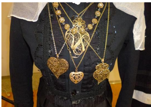
Figura 7. Disposição das peças de ouro em filigrana no Traje feminino de Noivos.

Um facto que corrobora a reflexão de eixo vertical existente na globalidade dos trajes é a própria disposição das peças de ouro em filigrana abundantes no Traje feminino de Noivos (figura 7). Veja-se o modo como as peças são cuidadosamente dispostas em cima do casaco preto do traje e buscam simetria, ainda que por serem todas as filigranas diferentes, tal acabe por não acontecer.