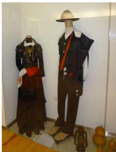
Figura 1. Traje de Encosta, Festa ou Domingueiro.