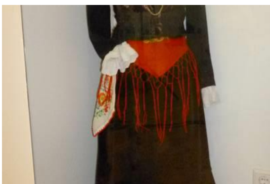
Figura 6. Lenço dos namorados do Traje feminino de Encosta, Festa ou Domingueiro.

Um facto que corrobora a reflexão de eixo vertical existente na globalidade dos trajes é a própria disposição das peças de ouro em filigrana abundantes no Traje feminino de Noivos (figura 7). Veja-se o modo como as peças são cuidadosamente dispostas em cima do casaco preto do traje e buscam simetria, ainda que por serem todas as filigranas diferentes, tal acabe por não acontecer.