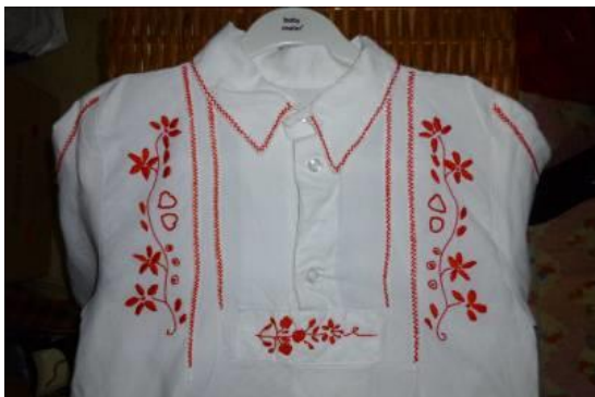
Figura 5. Camisa do Traje masculino de Encosta, Festa ou Domingueiro.

Encosta, Festa ou Domingueiro (figura 6) impossibilita que a reflexão de eixo vertical deixe a figura do traje invariante.