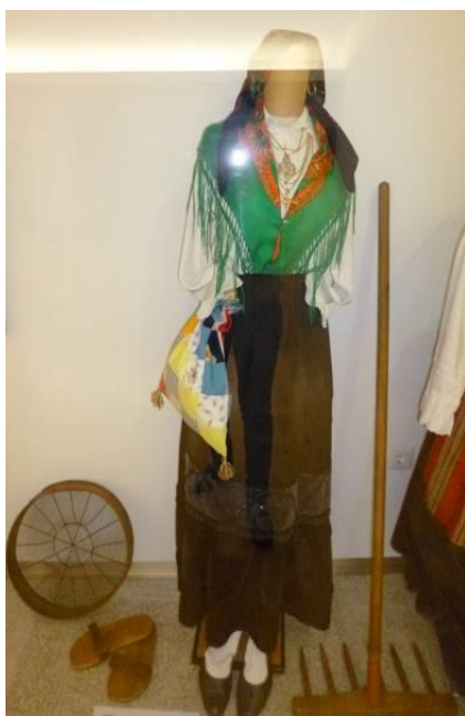
Figura 3. Traje de Ribeira, Feira ou Lavradeira.