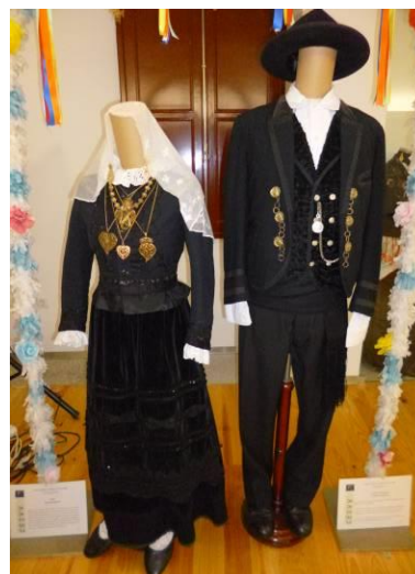
Figura 2. Traje de Noivos.