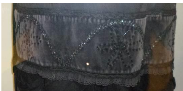
Figura 8. Friso presente no Traje feminino de Ribeira, Feira ou Lavradeira .

Finalmente, uma breve incursão aos frisos abundantemente presentes nos trajes dos dançarinos do Grupo Folclórico de Vila Verde. Partindo da categorização de Crowe (2004), que estabelece a existência de sete tipos diferentes de frisos, verifica-se a presença de alguns destes frisos nos trajes. A título exemplificativo, veja-se o friso presente na parte inferior da saia do Traje feminino de Ribeira, Feira ou Lavradeira (figura 8). Este é um friso gerado por translações (p111). O mesmo tipo de friso é também visível na saia do Traje feminino de Noivos (figura 9), afigurando-se, para já, como o friso mais frequente nos trajes.