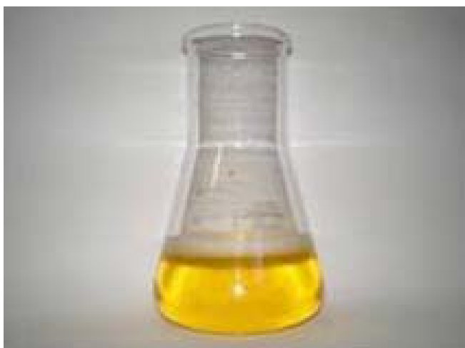
Fig. 2. Solução \beta -caroteno/ácido linoléico.