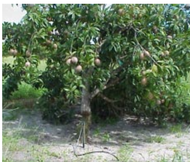
FIG. 4. Planta irrigada, com 5 anos de idade, em Paraipaba, Ceará.