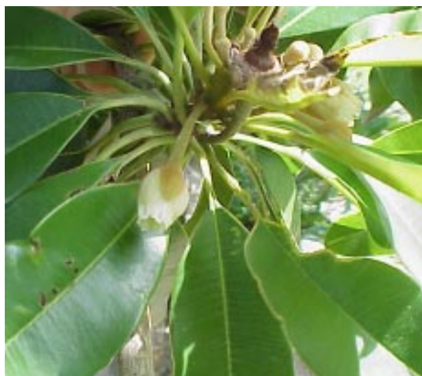
FIG. 5. Planta de sapoti com botão, flor e fruto juntos.