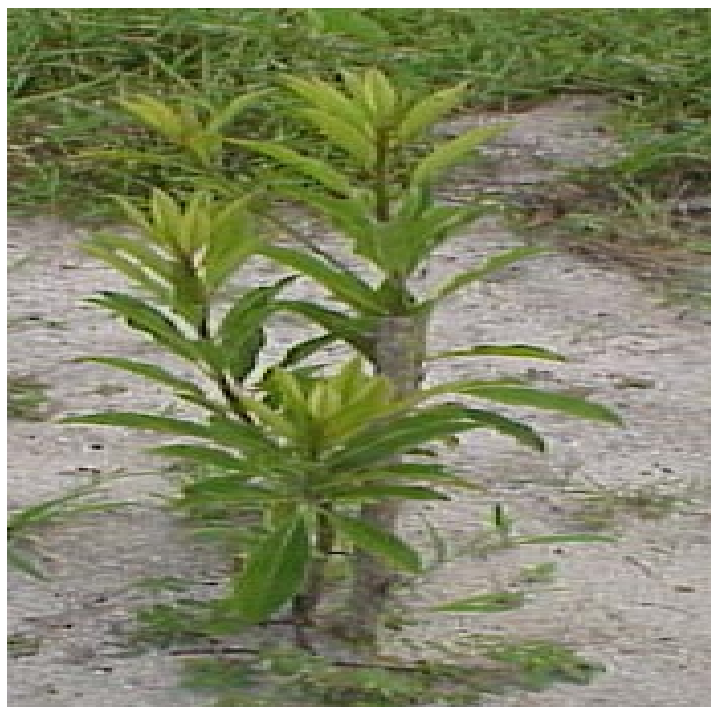
FIG. 2. Desenvolvimento da muda plantada em Paraipaba, CE.