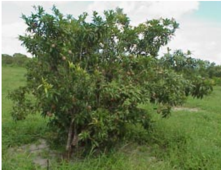
FIG. 1. Aspecto geral da planta adaptada ao litoral nordestino.

concentra-se na região metropolitana de Fortaleza em plantios de fundo de quintal. A pressão urbana tem provocado um decréscimo acentuado da produção e da oferta de sapoti nas feiras livres e na CEASA de Fortaleza. Ações de pesquisa e desenvolvimento de técnicas de enxerto, iniciadas em 1975 nos Campos Experimentais de Pacajus e Paraipaba, da Embrapa, tendem a reverter esta situação, sobretudo pela geração e difusão de técnicas de irrigação e manejo da planta no Estado do Ceará. Conseqüentemente, novos pomares de sapoti estão sendo iniciados com o uso de técnicas de clonagem e métodos modernos de irrigação (Fig. 2).