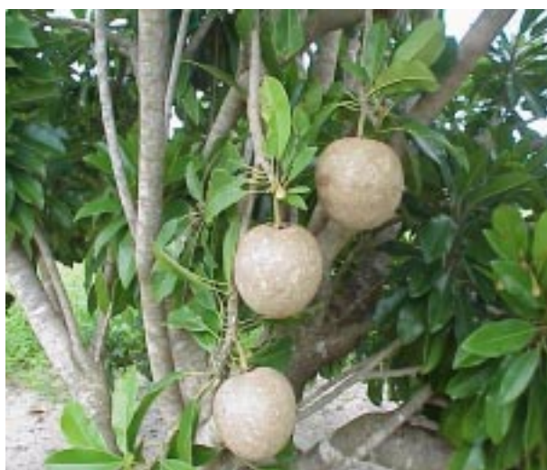
FIG. 3. Sapotizeiro com 5 anos de idade em plena produção, no litoral do Ceará.

O experimento foi implantado em janeiro de 1995, no Campo Experimental Vale do Curu (CEVC) da Embrapa Agroindústria Tropical, localizado no Perímetro Irrigado Curu-Paraipaba, Município de Paraipaba, CE. O local apresenta como coordenadas geográficas 3° 17' latitude