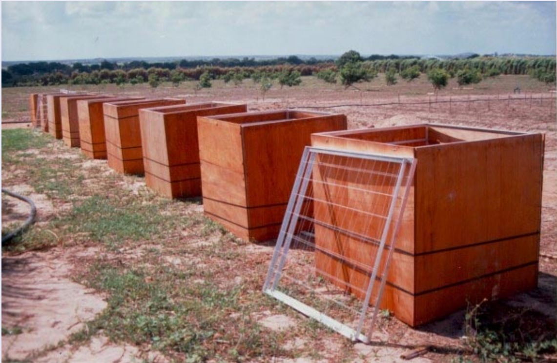
FIG. 2. Caixotes de madeira com estrutura interna de alumínio para o estudo do desenvolvimento das raízes.