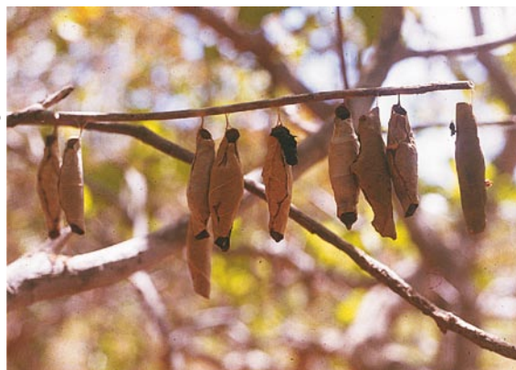
Figura 9. Lagarta saia-justa morta por inimigos naturais em campo.