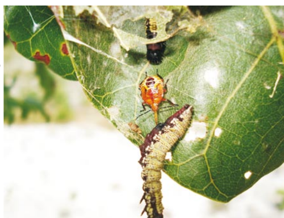
Figura 10. Lagarta saia-justa sendo sugada por percevejo predador.