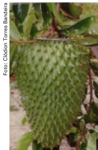
Fig. 2. Graviola tipo Morada.

O solo do local do experimento é classificado como Podzólico Vermelho-Amarelo distrófico e apresenta relevo plano.