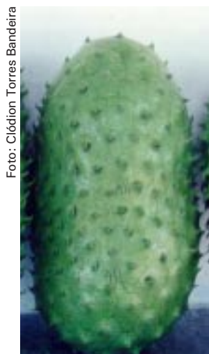
Fig. 1. Graviola tipo Lisa.