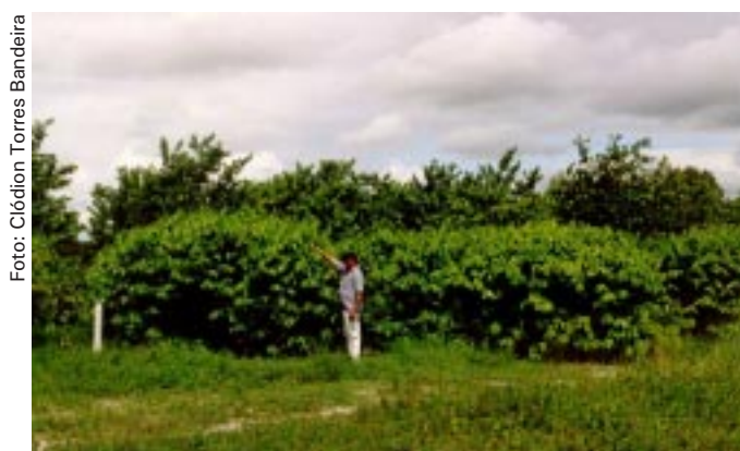
Fig. 3. Plantas podadas versus não podadas (ao fundo).

A altura das plantas foi controlada por podas realizadas duas vezes ao ano, em janeiro/fevereiro e junho/julho (Fig. 3 e 4), feitas uniformemente a uma altura de 2,30 m, somente no topo, evitando-se o corte de ramos laterais, a menos que ocorresse entrelaçamento. O plano de adubação, em quantidades crescentes do primeiro ao quarto ano, é mostrado na Tabela 1.