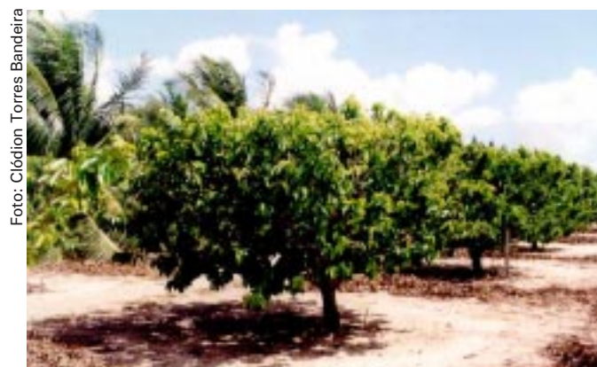
Fig. 4. Plantas podadas a 2,30 m, duas vezes ao ano.