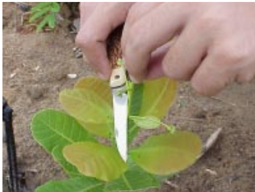
Fig. 1. Detalhe da retirada de panículas em plantas de cajueiro anão precoce aos 4 meses após o plantio.