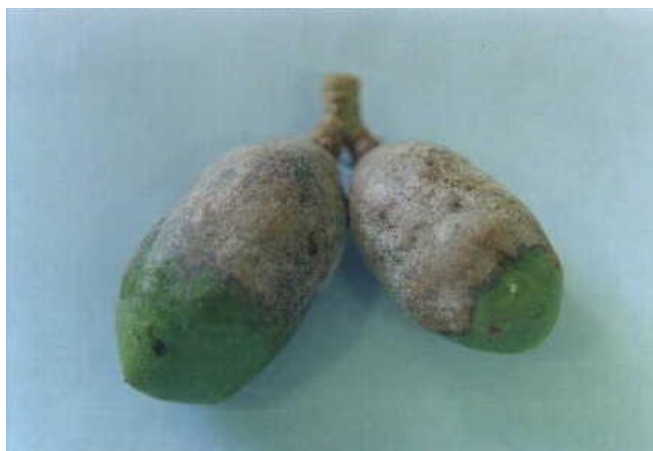
Figura 1. Lesões em frutos de cirigueleira provocadas pelo fungo Oidium sp.

A infecção é mais prejudicial quando incide sobre frutos nos estádios iniciais de desenvolvimento, em virtude de deixá-los manchados, muito embora, às vezes, eles ainda possam atingir a maturidade (Figura 1).