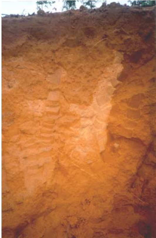
Perfil de Latosolo Vermelho-Amarelo.