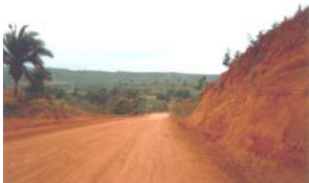
Paisagem de ocorrência de Latossolo Vermelho-Amarelo.