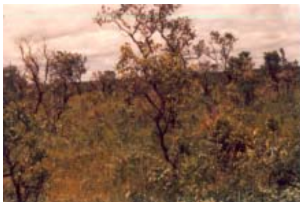
Paisagem de ocorrência de Areias Quartzosas no cerrado.