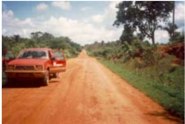
Paisagem de ocorrência de Areias Quartzosas.