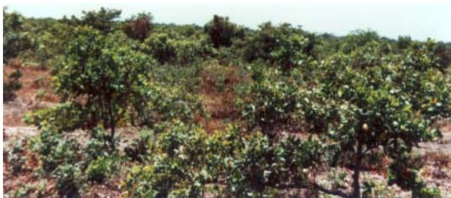
Plantio de cajueiro anão precoce em Areias Quartzosas.