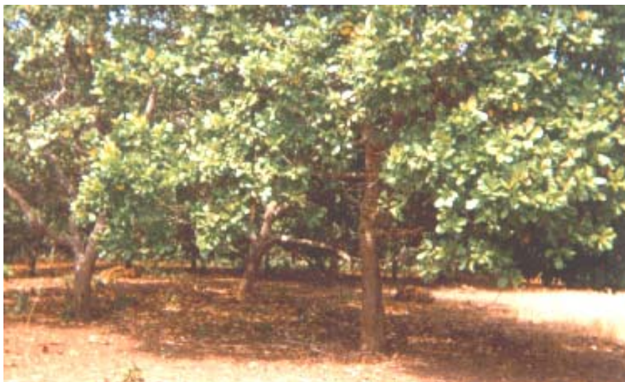
Plantio de cajueiro em Latossolo Areias Quartzosas.