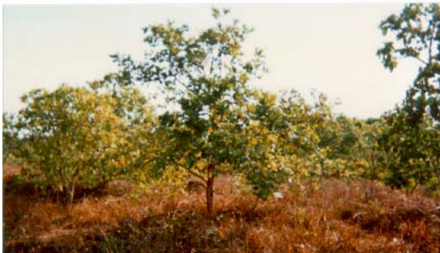
Plantio de cajueiro em Latossolo Vermelho-Amarelo.