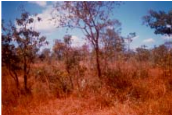
Paisagem de ocorrência de Areias Quartzosas no cerrado.