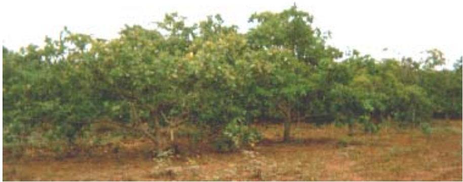
Plantio de cajueiro.