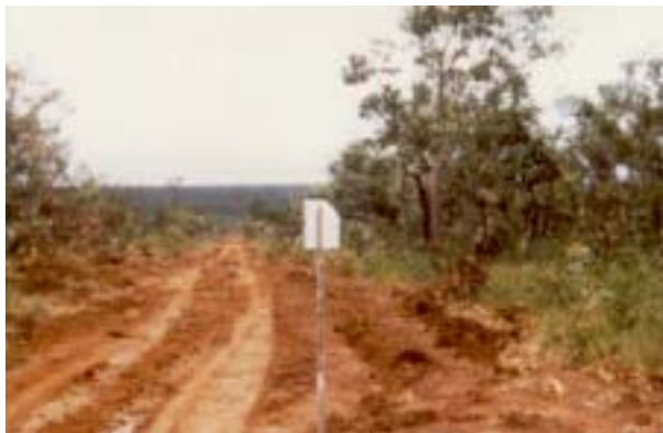
Paisagem de ocorrência de Latossolo Vermelho- Amarelo.