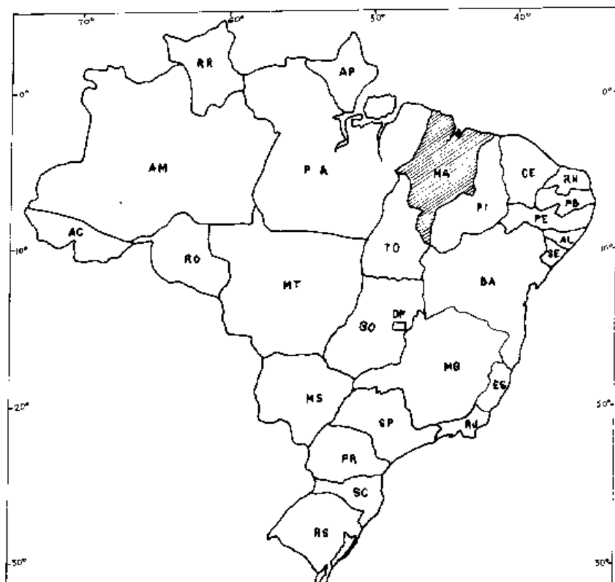
FIG. 1. Mapa do Brasil mostrando a localização do Estado do Maranhão.

Limita-se ao norte com o oceano Atlântico, ao sul com o Estado de Tocantins, a leste com o Estado do Piauí e a oeste com o Estado do Pará.