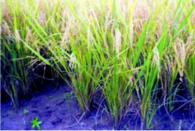
Fig. 3b. Aplicação 1/2 de N no plantio e 1/2 no perfilhamento ativo.