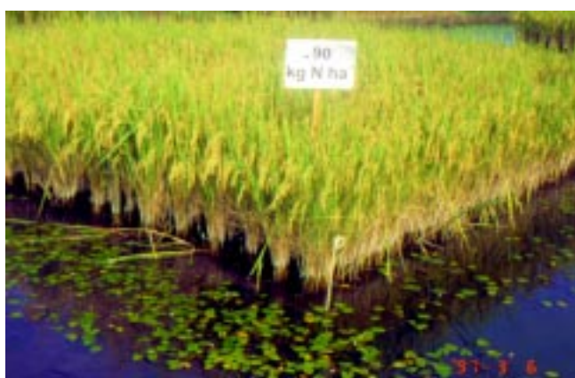
Fig. 2b. Parcelas com 90 kg N ha -1 .