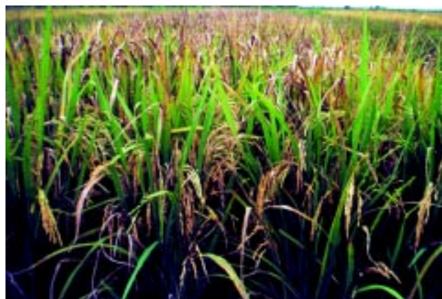
Fig. 3a. Aplicação total de N no plantio.

Nos experimentos conduzidos em diversos locais na região tropical, as maiores produtividades de grãos foram verificadas quando o N foi aplicado na semeadura, juntamente com o fósforo e potássio, e em duas coberturas, ou seja, por ocasião do perfilhamento efetivo, cerca de 45 dias após a emergência das plântulas (DAE) e na diferenciação do primórdio floral, aproximadamente aos 65 DAE, dependendo da cultivar. A aplicação tardia desta última cobertura pode favorecer a ocorrência de brusone nas panículas. Outra alternativa seria efetuar a adubação nitrogenada em duas épocas, ou seja, aplicação parcelada da metade do N na semeadura e, a outra metade, no estágio de perfilhamento efetivo. A ocorrência de brusone nas folhas pode ser favorecida pelo fornecimento de maiores quantidades de N na semeadura, portanto, nesta situação, o tratamento de sementes das cultivares susceptíveis é indispensável. Na aplicação na semeadura, parte do N poderá ser fornecido a lanço e o restante mediante o adubo formulado no sulco, juntamente com o fósforo e potássio. Isto poderá resultar em redução do custo da adubação. A aplicação de todo nitrogênio por ocasião do plantio propiciou menor resposta do arroz, indicando a ocorrência de maiores perdas de N (Figura 3a, b, c).