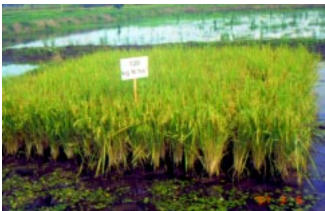
Fig. 2c. Parcelas com 120 kg N ha -1 .