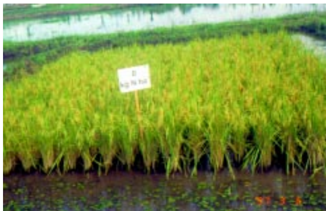
Fig. 2a. Parcela com zero kg N ha -1 .