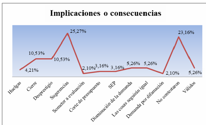
Figura 3. Porcentaje de alumnado que identificaron implicaciones y consecuencias. Elaboración propia.

Solamente cinco alumnos que corresponde al 5.26% lograron acercarse a la respuesta correcta. No obstante, en cuanto al punto de vista del autor, éste si fue fácilmente localizado por el alumnado.