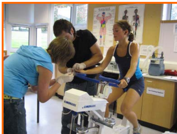
Figura 2.- Ejemplo de recogida de una muestra de sangre para determinar la glucosa durante el ejercicio.

Cada participante cumplimentó un consentimiento firmado de un cuestionario sobre la historia clínica y su acuerdo con la participación en el estudio. Además, se llevaron a cabo protocolos de seguridad requeridos para las muestras de sangre (figuras 1, 2 y 3).