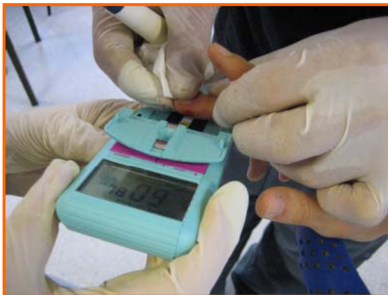
Figura 3.- Ejemplo de cómo se determinó el lactato en sangre

Cada prueba consistía en rendir 45 minutos a la máxima intensidad en el cicloergómetro de la marca y modelo “Monark 884E” (figura 4); ingiriendo una solución placebo, otra de baja y otra de alta concentración de CHO en cada prueba. Cada participante ingirió 5 ml por kilogramo de peso corporal de fluido 30 minutos antes de la prueba (por ejemplo, la participante de 48 kg, mujer, ingiere 245 ml 30 minutos antes de la prueba). Y durante la prueba, cada participante consumió 2 ml por kilogramo de peso cada 10 minutos, por ejemplo, el participante anterior ingiere 98 ml cada 10 minutos. Se recomendó a los participantes beber a pequeños sorbos para prevenir náuseas. Las tomas de datos se realizan justo antes de beber la solución.