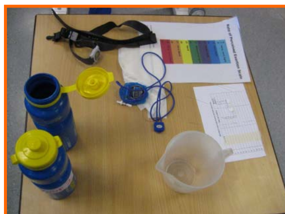
Figura 5.- Material utilizado.

Cada participante realizó 5 minutos de calentamiento a una intensidad media. Se midió la frecuencia cardiaca de reposo antes de cada prueba. Para evitar que los sujetos tuvieran una ventaja o influencia psicológica, fue un estudio de doble ciego. Las soluciones no fueron utilizadas con los detalles de su contenido pero se midieron según las características del participante (con recipientes de medida y soluciones, Figura 5). Para medir la intensidad del ejercicio fue utilizada la escala del ratio de percepción de Borg (1982) (figura 5).