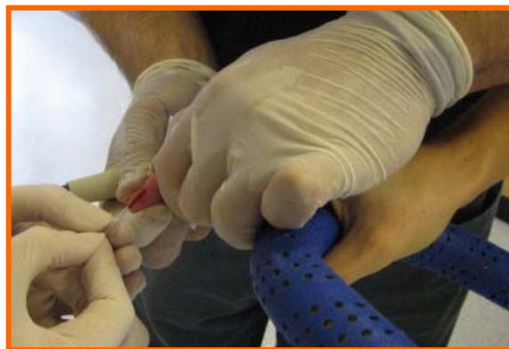
Figura 1.- Ejemplo de recogida de una muestra de sangre para determinar la glucosa.

dos semanas. Se controló que los participantes comieran moderadamente dos o tres horas antes al rendimiento de la prueba y se les aconsejó continuar con una dieta equilibrada durante las semanas que duró la investigación. Los participantes debían seguir unos patrones de ejercicio similar el día previo a cada prueba.