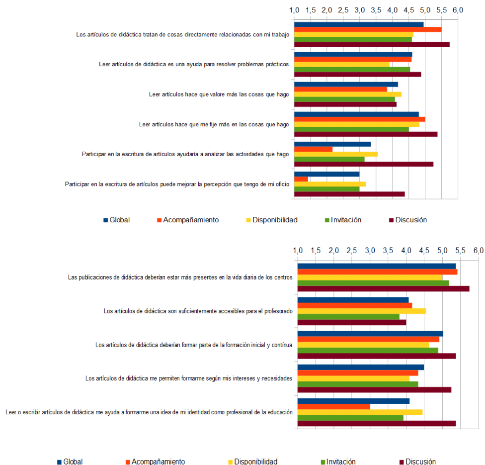
Figura 1.- Medias de valoración de los distintos ítems en la encuesta según la actividad de formación. Cada valoración se representa identificada con un color distinto según se indica en la leyenda. Se ofrecen también los valores medios ponderados como “Global”.

puntuación más alta, mientras que las modalidades de Invitación o Disponibilidad resultan en valoraciones más modestas.