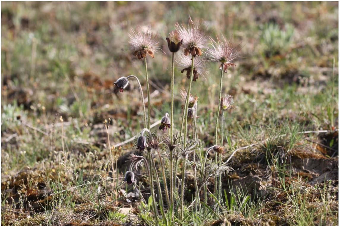
Abbildung 2: Die Wiesen-Küchenschelle ( Pulsatilla pratensis subsp. nigricans ) konnte nach der Wiederausbringung aus Erhaltungskultur an ihrem einzigen Wuchsort in Berlin wieder eine stabile Population aufbauen.