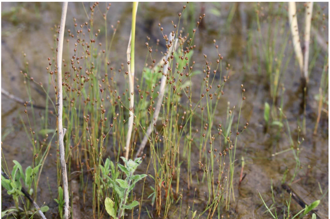
Abbildung 5: Im Landschaftspark Rudow-Altglienicke konnten sich große Bestände der Sand-Binse ( Juncus tenageia ) etablieren. Die Diasporen stammten aus dem Juncuspfuhl und wurden mit Substrat übertragen (Foto: Justus Meißner).