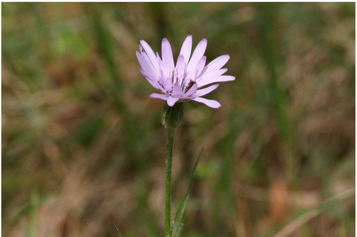
Abbildung 3: Die Violette Schwarzwurzel ( Scorzonera purpurea ) an ihrem letzten Berliner Fundort im Forstrevier Rahnsdorf. Zur Erhaltung der Art wurden 2017 Diasporen für eine Vermehrungskultur entnommen, außerdem wurde mit einer gezielten Mikro-Habitatpflege begonnen.