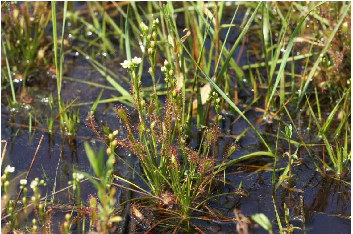
Abbildung 4: Der Mittlere Sonnentau ( Drosera intermedia ) war 2001 in Berlin verschollen. Nach Moorrenaturierungsmaßnahmen konnte die Art im NSG Krumme Laake/Pelzlaake und im Teufelsmoor Köpenick wiedergefunden werden.