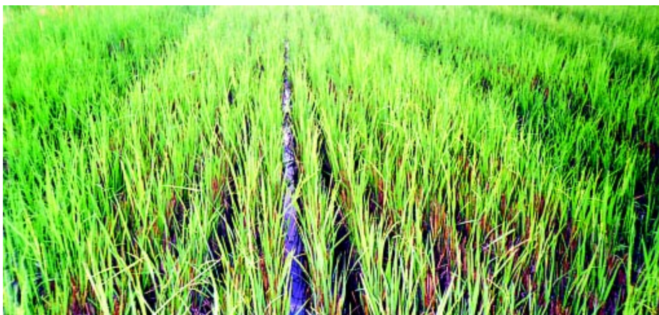
Fig.2. Soca de arroz irrigado onde a colheita principal foi realizada com colhedora equipada com picador de palha.

A colheita da cultura principal realizada com colhedoras equipadas com picador de palha (Figura 2) propicia, na soca, maior produtividade e rendimento de grãos