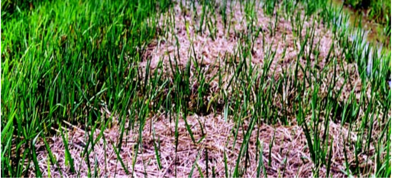
Fig.3. Soca de arroz irrigado onde a colheita principal foi realizada com colhedora sem picador de palha.

inteiros que a feita sem picador (Figura 3). O sistema de colheita influencia substancialmente o comportamento da soca, tanto no que se refere à produtividade quanto a qualidade do produto colhido, pois a leira de palha que se forma sobre os colmos remanescentes da cultura principal dificulta o crescimento dos perfilhos e favorece a ocorrência de doenças. Com isso, o uso do picador de palha é fundamental.