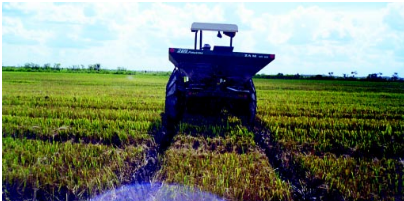
Fig.4. Adubação nitrogenada na soca de arroz irrigado efetuada logo após a colheita da cultura principal.

com a aplicação de 56 \text{ kg ha}^{-1} de N (Figura 5). A produtividade máxima econômica foi calculada em 3518 \text{ kg ha}^{-1} , com uma dose econômica de 53 \text{ kg ha}^{-1} .