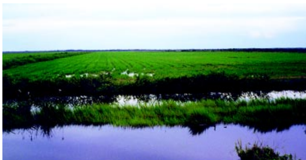
Fig. 1. Área de cultivo da soca de arroz irrigado no Estado do Tocantins

No Brasil, embora não se disponha de levantamentos específicos quanto à área envolvida no cultivo da soca, presume-se que vários produtores, em diferentes regiões do País, conhecem e utilizam este sistema de produção, em pequenas áreas, para aumentar a renda familiar. Mais recentemente, esta prática tem sido experimentada em regiões tropicais, principalmente no Estado do Tocantins (Figura 1), onde tem despertado grande interesse dos produtores, em decorrência da obtenção de relação benefício/custo