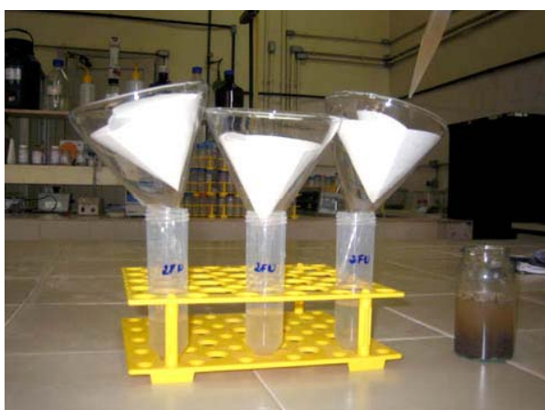
Figura 2 – Filtração do material extraído

Agitar por 30 minutos em agitador orbital a 220 RPM, esperar decantar por 30 minutos e transferir o sobrenadante com o auxílio de uma pipeta para um filtro de papel acoplado a funil e tubo de 50 mL, evitando resuspensão e recuperação de material decantado (Figura 2). Ao final da filtração é obtido o extrato de cada sub-amostra (fumigada ou não-fumigada), que devem ser direcionadas para quantificação do nitrogênio microbiano ou armazenados em geladeira a 4°C por no máximo 10 dias.