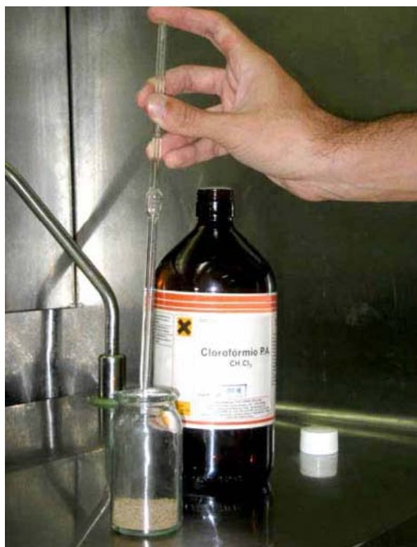
Figura 1 – Adição direta de clorofórmio na amostra

Imediatamente após a pesagem da amostra de solo adicionar aproximadamente 1 mL de clorofórmio isento de etanol com o auxílio de uma pipeta com graduação de 1 mL, em todos os frascos destinados a fumigação (Figura 1). Os frascos são em seguida fechados e armazenados em local isento de luminosidade por 24 horas, com temperatura em torno de 25 a 28°C. No dia seguinte retirar a tampa dos frascos em capela de exaustão, deixando evaporar todo o clorofórmio presente até eliminação completa, como preconizado por BROOKES et al. (1982) e WITT et al. (2000).