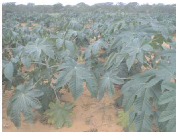
Fig. 1. Mamoneira da cultivar BRS Nordestina em fileiras adensadas, livres de plantas daninhas e em regime de sequeiro.

nesta fase a mamoneira deve estar isenta da presença de plantas daninhas. Azevedo et al. (2007) citam que qualquer planta, cultivada ou não, que se desenvolva onde não é desejada, é uma planta daninha e interfere em vários setores da atividade humana, incluindo a agricultura, e, além de reduzir o rendimento, eleva os custos de produção. De acordo com Severino et al. (2006b), o efeito das plantas daninhas sobre a mamoneira, pode ser atribuído tanto à competição pelos fatores ambientais (água, luz e nutrientes), bem como ao efeito alelopático das plantas invasoras. Os referidos autores acrescentam que o plantio de uma área extensa, na qual o controle das ervas não seja adequado, resulta em menor produtividade que o plantio de uma área pequena, onde se mantém as plantas daninhas sob controle (Figura 1).