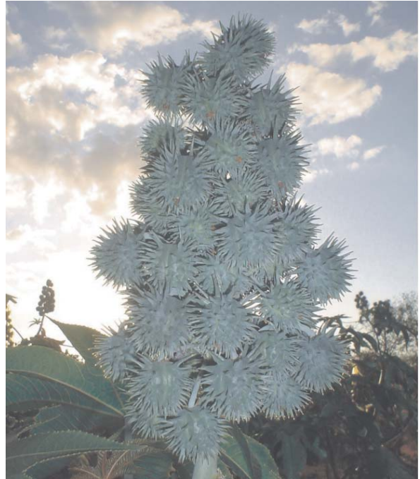
Fig. 3. Racemo de mamona cv BRS Nordestina, contendo muitos frutos. Campina Grande-PB, 2006

Souza e Távora (2006) mencionam que a mamoneira pode produzir de 15 a 80 cápsulas por ciclo; no entanto, Lucena et al. (2008) relatam que o número de racemos que a mamoneira poderá produzir ao longo do período produtivo está relacionado à fatores inerentes à planta (genética, quantidade de flores femininas) e as condições adafoclimáticas e sob condições adequadas, as plantas podem florescer/frutificar durante todo o ano (Figura 4).