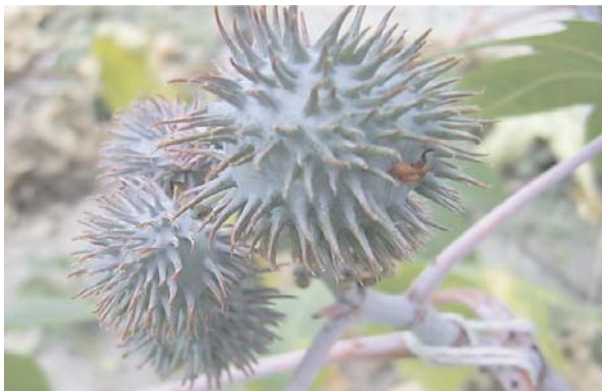
Fig. 2. Racemo de mamona cv BRS Paraguaçu, contendo poucos frutos. Campina Grande-PB, 2007.