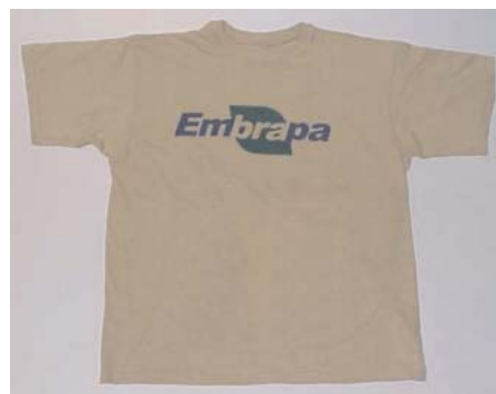
Camisa confeccionada com a com fibra BRS 200 Marrom

A não utilização de corantes químicos (anilinas) reduzirá, conseqüentemente, a poluição ambiental;