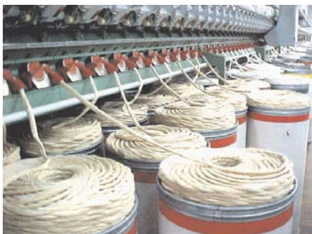
Aspecto de filatório Open-end operando com fibra BRS 200 Marrom