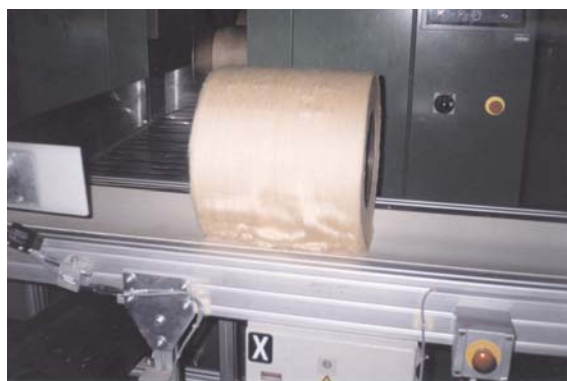
Aspecto da fita de UNILAP da fibra BRS 200 Marrom.

Rh - rotor/hora, % Efic. Carro - carro emendador de fio, Rupturas - quebra de fio, RPM - rotação por minuto. Fonte: (Santana et al., 1999).