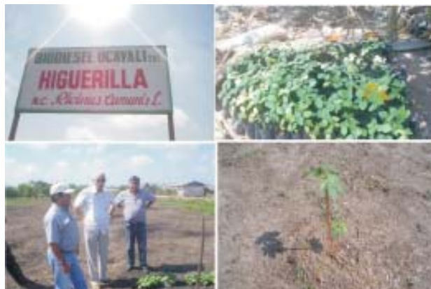
Fig. 3. Área plantada com sementes de mamona coletadas na região (espontâneas) e viveiro de mudas feito pela empresa Biodiesel Ucayali em Pucallpa, Peru.

3) Visita a um viveiro de produção de mudas de dendê para projetos locais de incentivo ao cultivo desta palmácea.