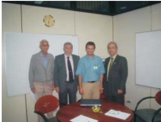
Fig. 5. Reunião com diretores e técnicos do DEVIDA em Lima sobre as conclusões da viagem e os próximos passos do projeto de cooperação.