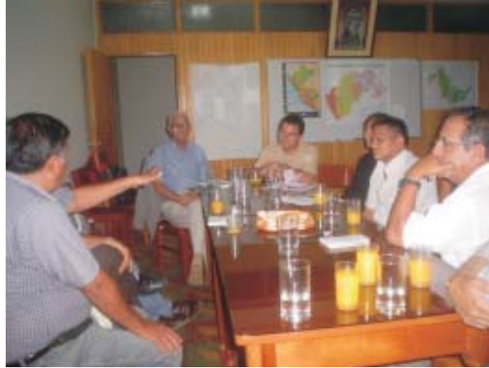
Fig. 2. Reunião com técnicos peruanos na sede do DEVIDA em Pucallpa para discussões sobre o projeto de promoção do cultivo de mamona.

empresa privada Biodiesel Ucayali nas proximidades da cidade de Pucallpa (Figura 3).