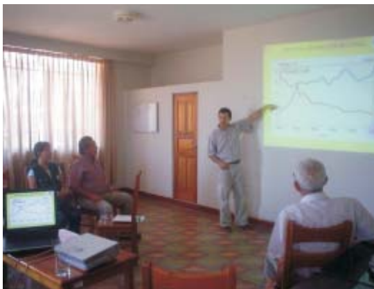
Fig. 4. Palestra para técnicos sobre o cultivo de mamona e estratégias para promoção desse cultivo na região.