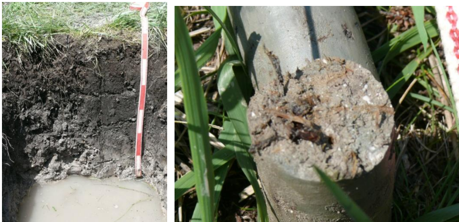
2. ábra: Redukált és oxidált állapotú vas megjelenése a Mocsárrét talajában (helyszínen készült fotó)

A nedves réten végzett talajszelvény-vizsgálatok szerint a területre a típusos réti talaj a jellemző. Az alapkőzet a már említett homokos üledék. Az elkülöníthető talajszieintek száma a talajvízmélység függvényében változott. Az egész területre jellemző a különlegesen magas vastartalom, amely a talajvízszint ingadozásának sávjában szürkés-kék, glejes kiválásokat eredményezett (2. ábra). Ezt lényegében a vas redukált formája ( Fe^{2+} ) okozza. Ebben a szürkés-kék sávbán a növények gyökérzete körül vöröses foltok, csíkok láthatók, amely a gyökerek oxidáló hatásának ékes bizonyítéka, hiszen a foltokat a vas másik, oxidált formája ( Fe^{3+} ) miatt láthatjuk. Röntgenfluoreszcencia-mérések igazolták a magas vastartalmat a mocsárrét talajából vett mintákban, amely esetenként eléri a 20-30 %-ot is. Az egyik talajszelvény ásásakor a talajvíz szintjét nem is sikerült elérni, mert egy teljesen megkövesedett vaskőpadszerű gyepvasérc tette lehetetlenné a további mélyítést. (3. ábra) A rétegből vett minta vastartalma megközelítőleg 14 % volt.