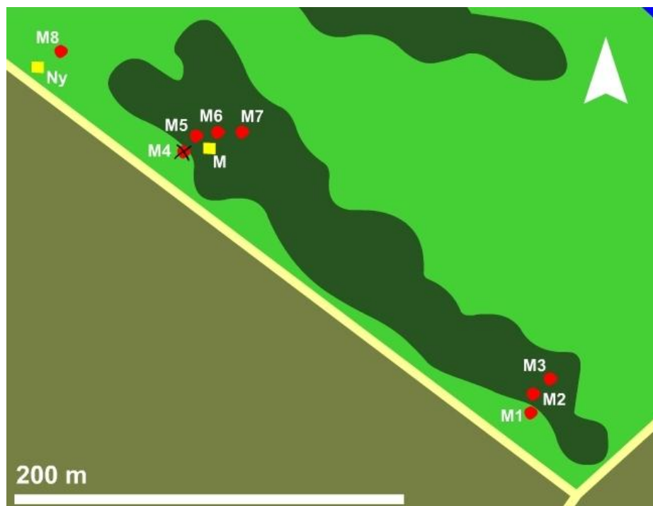
4. ábra: A mérési pontok (Piros pont – fúrások; sárga négyzet – mikroklíma-állomások; sötétzöld – mocsári növényzet; világoszöld – nedves rét; barna – lucernás kaszáló) (Google Earth műholdkép alapján)

A mikroklíma-mérések nem csak a jelen dolgozatban elemzett talajvíz-állapotok változásainak alátámasztására készültek, hanem kissé tágabb körben, ezért a felállításra került öt állomás közül csak kettő eredményeit használtuk. A kettő közül az egyik az M8-as pont közelében, „szélsőségesen nyílt”, pusztai viszonyokat (Ny), míg a másik a mocsár belsejében (az M6-os pont közelében) árnyékolt, széltől védett, páradús környezetet volt hivatva rögzíteni (M). Az elemzések során az előbbi állomás adatait a valóban nyílt területen levő M1-es és M8-as pont értékeivel, míg a mocsári állomás értékeit a belső területeken levő többi pont adataival vetettük össze. (4. ábra)