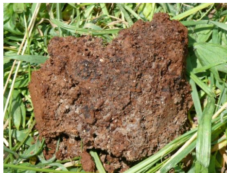
3. ábra: A gyepvasérből származó mintadarab (helyszínen készült fotó)