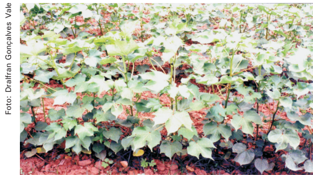
Fig. 4. Lavoura semeada e desbastada manualmente

Com o uso de herbicidas e de outros recursos tecnológicos, se recomenda, na semeadura mecanizada, regular a máquina semeadeira para a quantidade exata de sementes desejada para evitar a operação do desbaste; em relação a este dispositivo é aconselhável, também, levar em consideração o percentual de germinação da semente usada.