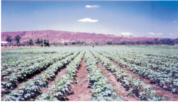
Fig. 6. Algodoeiro irrigado, em fileiras simples