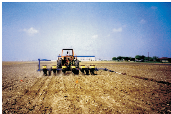
Fig. 1. Plantio mecânico tratorizado. Oeste do Estado da Bahia.