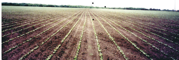
Fig. 2. Germinação do algodoeiro semeado mecanicamente. Cerrado do Estado da Bahia

Para germinar, crescer, desenvolver e produzir, o algodoeiro depende basicamente dos fatores climáticos umidade, temperatura e luminosidade e, para alcançar uma produção mínima aceitável, exige um montante de pelo menos 500 mm de água durante todo o seu ciclo (WADDLE, 1984). Do plantio ao início da floração a lavoura necessita de água em menor quantidade. O déficit hídrico ou o excesso de umidade no período compreendido entre 60 e 100 dias após a emergência (DAE) pode induzir à queda das estruturas frutíferas e comprometer a produção. Segundo Ferraz e Lamas (1988), 80% das estruturas responsáveis pela produção do algodoeiro são emitidos neste período, e a experiência tem mostrado que o plantio tardio em área irrigada, tende a reduzir a produção da planta do algodão por coincidir a colheita com o início do período chuvoso.