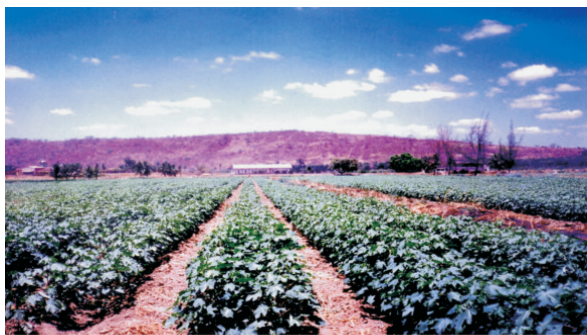
Fig. 7. Algodoeiro irrigado, em fileiras duplas