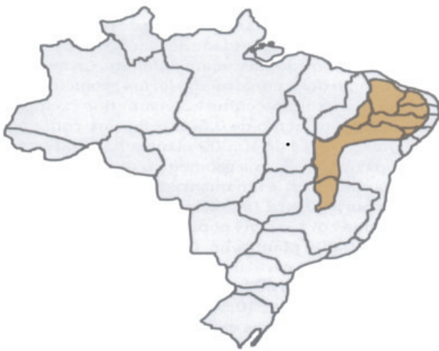
Fig. 3. Áreas com aptidão para o cultivo do algodão irrigado

No semi-árido, grande parte das áreas com potencial para o cultivo do algodoeiro irrigado localiza-se nos vales dos rios (Figura 3); para esta região e para as condições de cultivo em regime de irrigação, a melhor época de semeadura é o final do período chuvoso; este procedimento minimizará os efeitos maléficos de algumas pragas e doenças incidentes, durante a estação chuvosa, além de reduzir os riscos de se colher no início do próximo período chuvoso (EMBRAPA, 1993b).