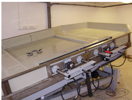
1. ábra. A modelltér feltöltés előtti állapotában, a villanymotorok és a dönthetőség a felső határon

A folyamatok időbeli változásnak követésére két megközelítést alkalmazunk. Egyrészt detektáljuk a kísérlet összes képi információját, valamint a modelltérben lejátszódó folyamatok fizikai paramétereit. A kísérlet lefolyását 8 db overhead CANON 1110 D fényképezőgép dokumentálja. A gépek egy konzolrendszeren helyezkednek el (2. ábra), egymástól változtatható távolságban, alapbeállításban 30 cm-es térközben és 1,2 m-es magasságban. A képek közötti átfedés 18-as gyújtótávolságnál megközelítőleg 80%, ami lehetővé teszi a 3D-s képalkotást, illetve terepmodell elkészítését. A fényképezőgépek USB összeköttetésen keresztül, saját fejlesztésű (CANON SDK alapú) szoftverrel vezéreltek.