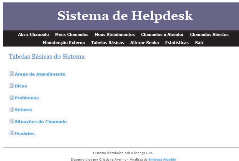
Fig. 2: Interface do sistema para cadastro das tabelas básicas