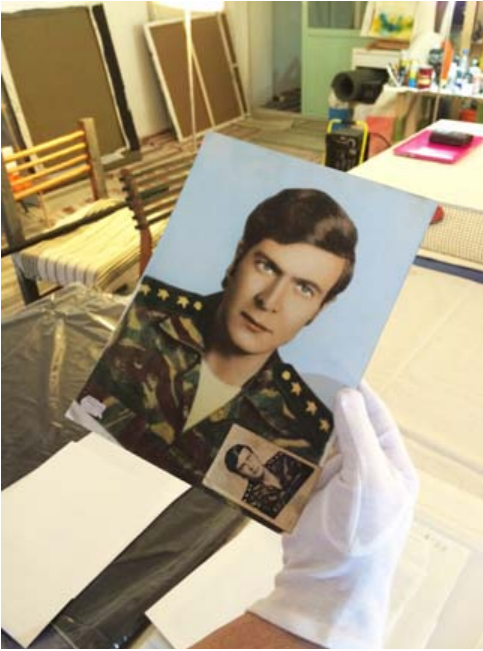
A portrait from a photographer's studio from the '70s. © Persefoni Myrtsou