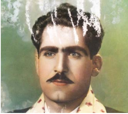
A portrait from the '60s partly destroyed by humidity

go back to Syria, the problem was resolved through the intervention of multiple friends of friends and informal agreements.