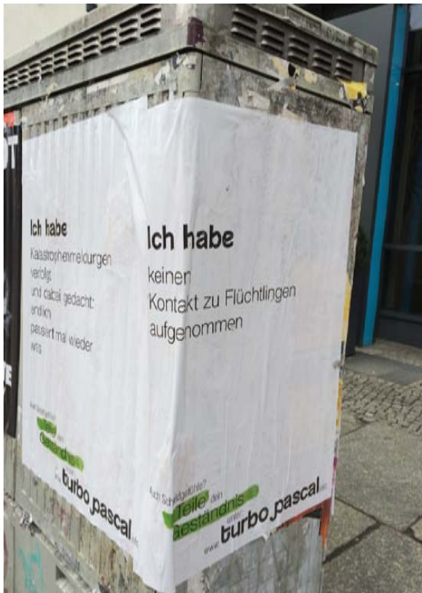
Plakat turbo pascal

Im Rahmen eines Seminars an der Humboldt Universität zu Berlin begaben wir uns als Kleingruppe im November 2015 an den Bahnhof Schönfeld. Dort Erlebtes wurde in Beobachtungsprotokollen festgehalten, später innerhalb der Kleingruppe und im Seminar diskutiert und soll nun vorgestellt werden. Bei unserem Feldaufenthalt haben wir uns unter die Geflüchteten gemischt, sind mit unserem Gewissen in Konflikt geraten, konnten als Freiwillige_r mithelfen und haben erfahren, wie es sich anfühlt, als Student_in der Ethnologie ›einfach mal zu gucken‹.