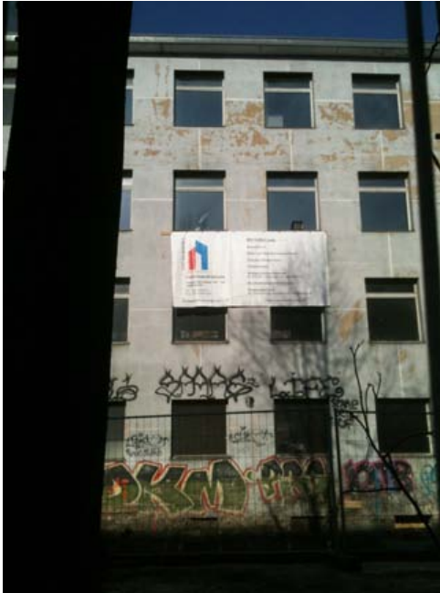
Abbildung 7: Seiteneingang der GHS: Werbetransparent der »OSZ Bautechnik« für das entstehende Apartmenthaus für betreutes Wohnen der ZIK (Zuhause Im Kiez) GmbH.

Demonstrant_innen und Geflüchteten hinterließen. Die Veränderungen des Raumes hingegen weisen bereits auf neue Nutzungen und Interessen hin: Zumindest aus einem Teil des Gebäudes der Gerhart-Hauptmann-Schule entsteht ein Apartmenthaus für betreutes Wohnen. Die Raumansprüche anderer Akteur_innen bestehen weiterhin und die politische Diskussion um die Unterbringung von so genannten »Flüchtlingsströmen« 6 zeigt, dass daraus auf Dauer auch neue Nutzungskonflikte entstehen können. Die ethnografische Erforschung dieses Raumes sollte daher auch ohne aktuell konflikthafte Situation fortgesetzt werden, um seine Veränderung über Zeit zu erfassen und damit Einblicke in andere Situationen und subjektive Wahrnehmungen zu ermöglichen, auch um ein Zeugnis dieser Veränderungen und Übergänge abzulegen.