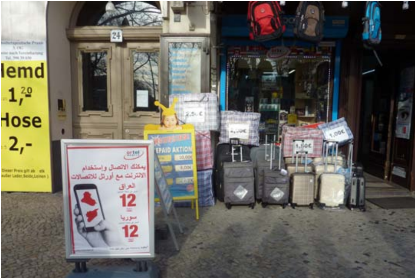
Handywerbung Turmstraße. Dezember 2015.

ten. Die Serviceökonomie rund um das LaGeSo passte sich schnell den neuen Anforderungen an. Aushänge an Hauswänden wiesen seit dem Sommer 2015 auf Arabisch den Weg zu Sprachschulen, die Deutschkurse für Geflüchtete anboten. Einige Restaurants, Imbisse und Kioske in unmittelbarer Umgebung des LaGeSo s bewarben ihr Angebot nun auf Arabisch. Besonders beliebt schienen Handyverträge mit Auslandflatrates zu sein. Aufsteller für Anrufpakete in die arabische Welt waren teilweise vollständig auf Arabisch verfasst (siehe Bild oben).