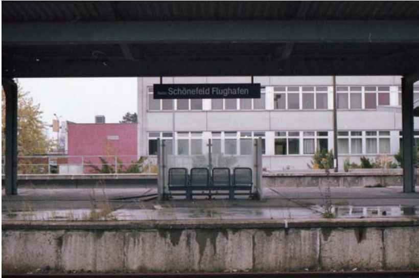
Berlin-Schönefeld; © Konstantin Krex

schen auf mich. Mir ist klar, dass sie mir ansehen, dass ich nicht aus den gleichen Gründen hier bin, wie sie. Die wartenden Menschen drinnen schienen sich da weniger für den Grund meiner Anwesenheit zu interessieren. Es war ihnen schlichtweg egal, so schien es. Als ich draußen vor einer Kolonne parkender Polizeiautos stehen bleibe und auf mein Telefon schaue, noch immer heften zahllose Blicke an mir, kommt der Einsatzleiter der Polizei auf mich zu. Ich schaue ihm lange ins Gesicht. Er sieht nett aus, aber ernst. Er fragt mich, in welcher Funktion ich hier bin. Ich antworte, dass ich in keiner Funktion hier bin, sondern aus Interesse. ›Ich will mir das einfach mal angucken‹, sage ich. ›Gut‹, erwidert er. ›Aber nicht die Abläufe stören, bitte‹. Ich entspreche seiner Bitte wohlwollend und er zieht zufrieden ab.« (Feldnotizen vom 11.11.2015)