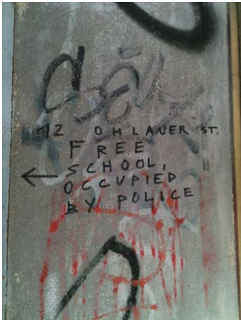
Abbildung 5: »12 Ohlauer. Free School, Occupied by Police«

Mir erschien es als sehr schwierig, meine verschiedenen Sinneserfahrungen zu trennen. Beispielsweise stand ich für etwa zehn Minuten mit verschlossenen Augen an der Ohlauer Straße Ecke Reichenberger Straße, um den Raum über Geräusche und Gerüche in mich aufzunehmen. Jedoch wurde alles was ich wahrnahm assoziativ mit Bildern in meinem Kopf verbunden, so wie ich den Raum eben vorher gesehen hatte. Auch eine Soundaufnahme hat für mich nicht nur über mein Gehör funktioniert, sondern hat sich unmittelbar mit Bildern der Straße, des Straßenverkehrs und den Menschen verbunden. Nach Sarah Pink (2000, 3) und Tim Ingold (2009, 27) sollten Sehen, Hören und Fühlen nicht als getrennte Aktivitäten betrachtet werden, sondern lediglich als unterschiedliche Facetten derselben Aktivität – der des ganzen Organismus in dieser spezifischen Umgebung. Darüber hinaus nicht nur in Bezug auf meine Sinne und meine Wahrnehmung verknüpft mit dem Raum, sondern auch in Verbindung mit meiner Erinnerung und meiner Vorstellung. Und dies gilt ebenso für Maltes Schilderungen seiner Situation. So stand das, was ich an