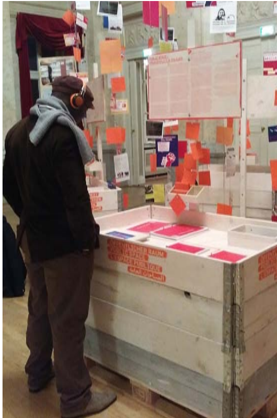
J. in der Ausstellung We will rise – Refugee Bewegung im Palais am Festungsgraben; © Kristine Wolf

sierte Findigkeit der débrouille hinaus »richtig Fuß zu fassen«. Anhand dieses festen Ziels stecken sie die aktuellen Herausforderungen ab: regularisation , das heißt einen stabilen, unbefristeten Aufenthaltstitel, eine Arbeitserlaubnis und ausreichend bezahlte Beschäftigung, Wohnung und (Weiter-)Bildungsmöglichkeiten. Der Weg dahin ist jedoch ungewiss. Zunächst geben sie sich dafür zwei Jahre.