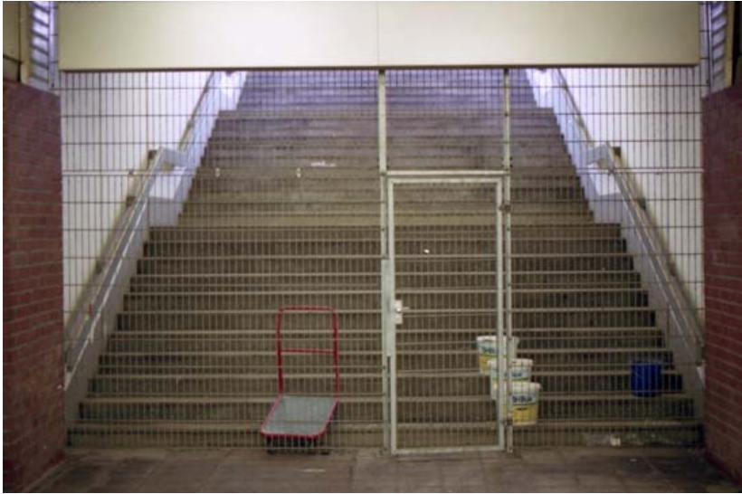
Bildunterschrift: Berlin-Schönefeld; © Konstantin Krex

Hier zeigt sich, dass verschiedene Fragen auch daraus entstehen, dass sich Forscher_innen in einer Art Doppelrolle bewegen. Forscher_innen sind erstens Bürger_innen dieser Gesellschaft und somit Teil des moralischen Wertesystems . Zweitens bedeutet Forscher_in zu sein, ein Forschungsinteresse zu verfolgen. Als Bürger_in steht die moralische Frage im Vordergrund: Darf ich nur gucken? Darf ich das oder bin ich dann Schaulustige_r? Als Forschende_r hingegen wird zusätzlich die methodische Frage relevant: Ist ›Gucken‹ ethnografisch sinnvoll? Das Unwohlsein über unsere Anwesenheit erscheint trivial, ruft man sich den Kontext des Feldes wieder in den Sinn. Als Akademiker_innen befinden wir uns in einer privilegierten Lage. Unser moralisierendes Gedankenspiel wirkt deplatziert im Kontrast zu der Situation der Geflüchteten und deren prekärer Lage. Es erscheint uns an dieser Stelle wichtig, den Unterschied in der schicksalsbestimmenden Tragweite einer Frage nach der Legalität als Mensch und der nach unserer Legitimität als Forschende zu betonen.