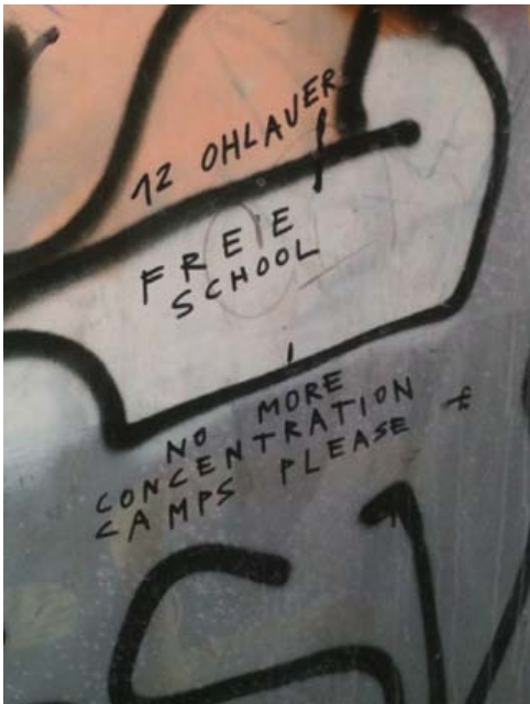
Abbildung 6: »12 Ohlauer. Free school, No More Concentration Camps Please«

Dieses Dilemma wird erst durch seine starken politischen und moralischen Überzeugungen aufgelöst, indem er die Konsequenzen seiner Handlungsmöglichkeiten miteinander aufwiegt. So erfüllt er zumindest eine Teilrolle, die ihn aus Solidarität zu den Geflüchteten handeln lässt. Auch an dieser