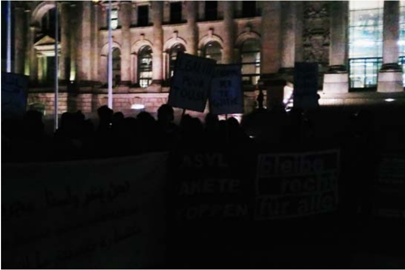
S. auf der Demo gegen Asylpaket II im Februar 2016

stelle antreten. Nichtsdestotrotz gibt ihm sein Anwalt zu bedenken, dass ein Arbeitsvertrag in keiner Weise vor Abschiebung bewahrt. Das zeigen in drastischer Weise die zahlreichen Fälle, in denen Menschen mit dem aufenthaltsrechtlichen Status der Duldung ausgewiesen oder zurückgeführt werden, obwohl sie zuvor jahrelang ein ›reguläres‹ Leben geführt hatten, und vermeintlich tadellos in die Gesellschaft integriert waren durch Schulbesuch, Ausbildung oder festen Arbeitsplatz.