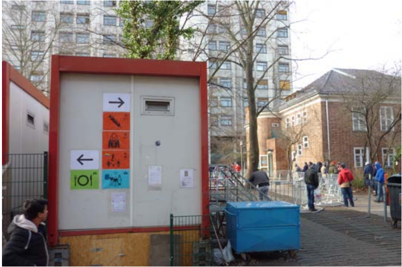
Piktogramme auf dem LaGeSo-Gelände. Dezember 2015.

»Der erste Gedanke, der mir in den Sinn kommt, ist jetzt wo das Wetter trocken ist, geht das noch, aber was passiert wenn wir in Kürze Schnee und Regen haben? 3 Die Kleidung der Geflüchteten ist bunt zusammengewürfelt, manche haben keine richtigen festen Schuhe, viele der Männer und Frauen sind noch mit einem T-Shirt und einer etwas dickeren Strickjacke gekleidet, manche versuchen sich mit Kapuzenpullovern, Mützen und Jacken gegen die Kälte zu schützen, wobei die Kinder meist gut eingepackt sind. Zwischendrin immer wieder Mitarbeiter_innen der Security-Firmen, die den Wartenden Anweisungen geben. Alle warten, kampieren, sitzen herum, reden miteinander, manche haben sich kleine Iglu-Zelte aufgestellt, wie man sie sonst in Vorgärten als Spielort für Kinder sieht. Hier dienen sie vor allem für die kleinen Kinder als Witterungsschutz. Ich schaue in die Gesichter der Menschen, viele sehen erschöpft aus, haben Augenringe. Aber sie scheinen die Hoffnung nicht aufzugeben.« (Feldtagebuch vom 30.10.2015)