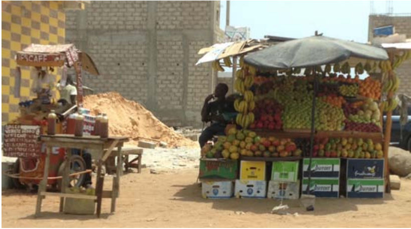
Street merchant in Dakar, 2015. Entering the city's informal economy has proven difficult for number of refugees.