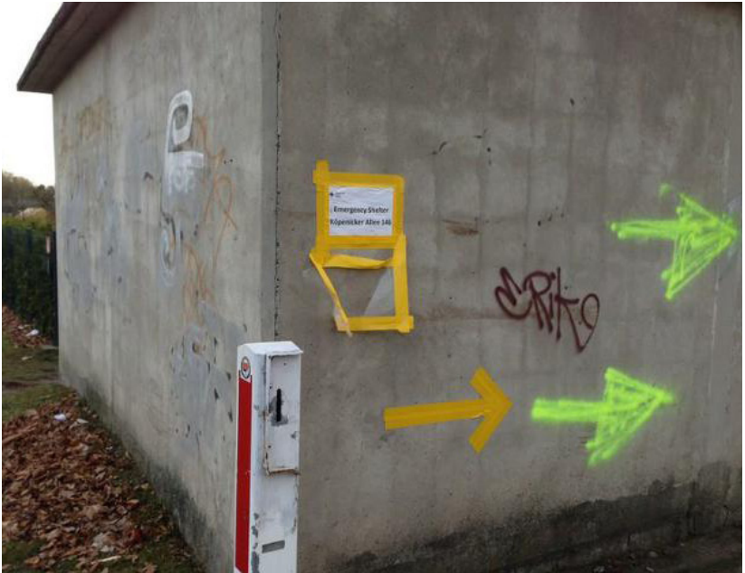
Zettel und Pfeile verweisen auf die Notunterkunft; © Meret Eikenroth