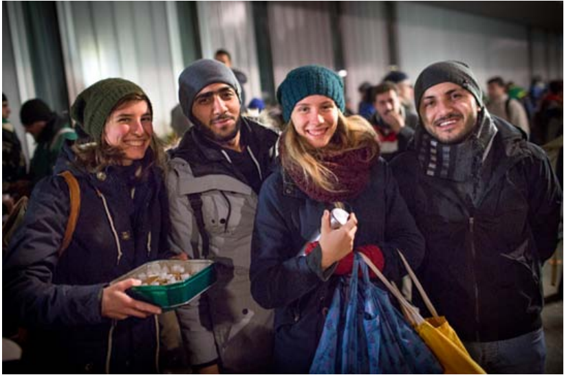
Ein Abend am LaGeSo. November 2015.

hofften. Durch den wachsenden Strom der Geflüchteten war die Behörde mit der Betreuung der Anliegen überfordert. Monatelang sorgte das Chaos vor dem LaGeSo bundesweit für mediale Aufmerksamkeit und die Behörde erfuhr Kritik aus politischer und zivilgesellschaftlicher Richtung. Dies führte im Dezember 2015 zum Rücktritt des LaGeSo Chefs Franz Allert. Die Aufnahmen der langen Warteschlangen vor dem Gebäude machten in der nationalen und internationalen Presselandschaft die Runde und standen den ersten euphorischen Eindrücken der deutschen Willkommenskultur 4 komplementär gegenüber. Die Überforderung des LaGeSos führte zu wochenlangen Wartezeiten der Geflüchteten unter prekären Bedingungen, weshalb viele Anwohner_innen ehrenamtliche Unterstützung anboten.