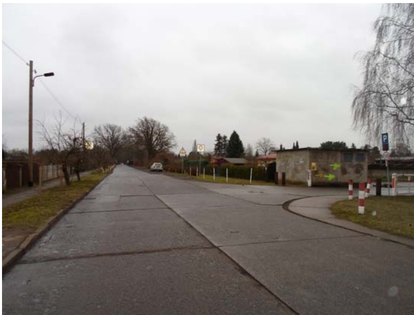
View of the entrance way to the shelter from the Köpenicker Allee

The setting was almost imposing itself to us. The obvious question was, how do the people who inhabited it perceive it? As we found out later, Köpenicker Allee, the street we walked down to get from the train station to the shelter, was the same one that connected the shelter to the youth centre Rainbow , and the people from the shelter walked or biked through it to get there. Both the