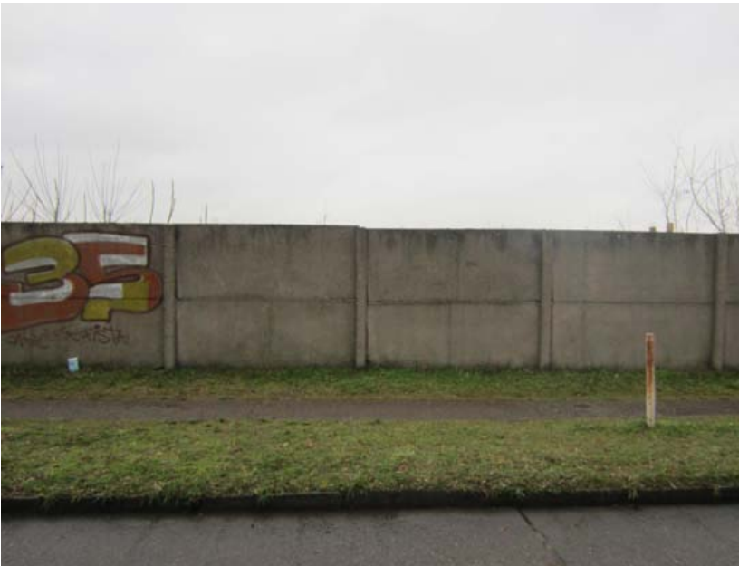
Zone 3; beide Fotos © Meret Eikenroth