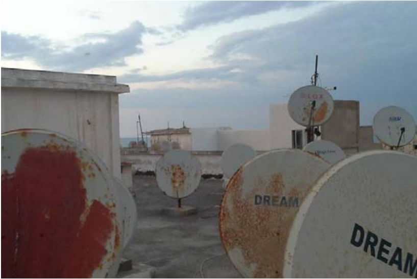
Satellitenschüsseln über Océan, einem Stadtviertel in Rabat, © Leonie Jegen

wie es Beck, Römhild, Sznajder oder Vertovec konzeptualisieren (Beck 2004; Beck/Sznajder 2006; Römhild 2007, 2009, 2014). Nämlich ein durch unterschiedlichste Migrationsbewegungen historisch gewachsener, durch neue und reaktivierte Mobilitäten sich stetig verändernder sozialer Raum. Er ist nicht zuletzt das Resultat der fortwirkenden historischen Verflechtungen Europas mit jenen Teilen der Welt, denen seit Ende des 15. Jahrhunderts der europäische Kolonialismus und Imperialismus aufgezwungen worden war. Das Ankommen der drei in Eisen' unterstützt zudem die Thesen des erkenntnistheoretischen Modells einer Autonomie der Migration (Bojadžijev/Karakayalı 2007; Mezzadra 2011; Moulier Boutang 2007; Scheel 2015). Demnach äußert sich die konflikthafte Relation zwischen selbstbestimmten migrantischen Praktiken des Grenzüberschreitens und den immer ausgefeilteren EU-staatlichen Versuchen, diese zu kontrollieren und zu regulieren in der Problematik »ob und wie viele Menschen versuchen, sich innerhalb und gegen das europäische Grenzregime Mobilität anzueignen und dadurch den politischen und ökonomischen Status quo, der durch dieses Grenzregime aufrechterhalten werden soll, in Frage stellen« (Scheel 2015, 2). Das Ringen um die Ausrichtung der gesellschaftlichen Verhältnisse im ›Zentrum‹, als das sich Europa weiterhin imaginiert, kristallisiert sich im gegenwärtigen Umgang mit Migrationspraktiken, die so zu umkämpften ›Kontrollzonen der Mobilität‹ wurden. Die