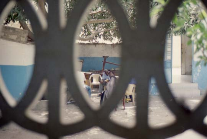
Street-level humanitarian taking a break in Dakar, Senegal.

However, paid sex does of course not correspond to relief organisations' image of entrepreneurship. Even though its financial outcome responds to incentives of financial autonomy put forward by interveners, paid sex does not represent an activity easily valuable, nor evaluable as such. It is hardly quantifiable as source of revenue, it implies physical and health related risks and slippages into situations of coercive or forced prostitution are hard to prevent. It is thus difficult for street-level humanitarian to speak of refugee women who live from paid sex as successful autonomous entrepreneurs.