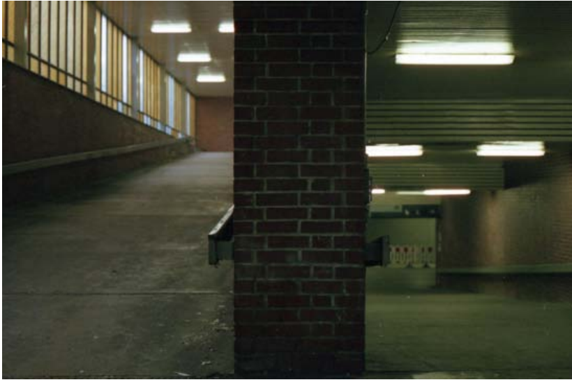
Bildunterschrift: Berlin-Schönefeld

wir es zumindest formulieren, in der Hoffnung, dass Begegnung zu mehr Verständnis führt. Kurzum sie formuliert das Hingehen und Hingucken als eine gesellschaftliche Pflicht.