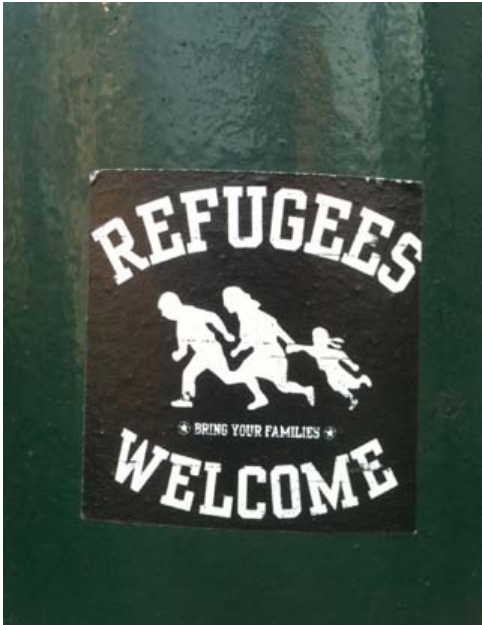
Abbildung 3: »Refugees Welcome: Bring Your Families« © Dženeta Hodžić

Jenseits des Zusammenhangs zwischen Raum und Befragten und der kognitiven und emotionalen Raumwahrnehmung, welche diesen Zusammenhang