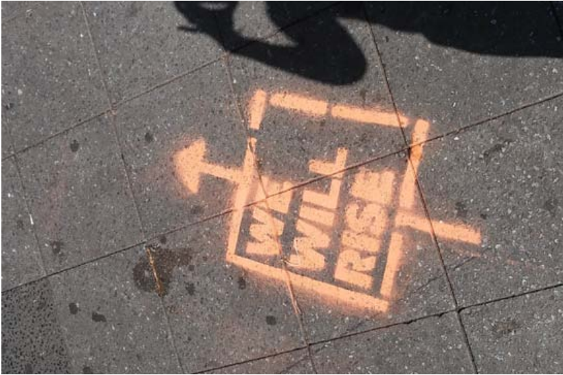
We will rise-tag am Kotti weit weg zum FHXB-Museum; © Kristine Wolf

anstatt nach Frankreich zu gehen. Frankreich ist mit zahlreichen seiner ehemaligen Kolonien auf dem afrikanischen Kontinent, darunter auch Kamerun, in komplexer Weise verbunden, die anhaltende neo-imperiale Verflechtungen offenbart. Sylvain argumentiert, dass es dort schon seit langer Zeit viele blacks und ernste Probleme mit Rassismus und Gewalt in den Vorstädten gäbe. Sie kämen da nur dazu und rechneten sich kaum Zukunftsperspektiven aus. Deutschland genieße paradoxerweise einen guten Ruf in Kamerun, da es als erste Imperialmacht das Land 35 Jahre lang kolonisiert und den dezentralen Städtebau vorangetrieben habe. Die Ära des darauffolgenden französischen Kolonialismus mit den bis heute vorherrschenden Konturen des Françafrique Systems würde von den Kameruner_innen dagegen sehr negativ erinnert. Außerdem sei ihnen bewusst, dass Frankreich wie Spanien aktuell von der Finanz- und Schuldenkrise betroffen sind, wogegen Deutschland viel mehr Arbeitsmöglichkeiten böte. Die unterschiedliche Ausgestaltung der Asylgesetzgebung in der EU, wobei Deutschland die schärfsten Bestimmungen aufweist, beeinflusste seine Entscheidung damals nicht. Der Begriff des angeblich so anziehenden Eldorado Europa , einer Chiffre, die in Presse und einschlägiger Forschungsliteratur häufig im Zusammenhang mit Migrationsursachen angeführt wird, fällt mit keinem Wort.