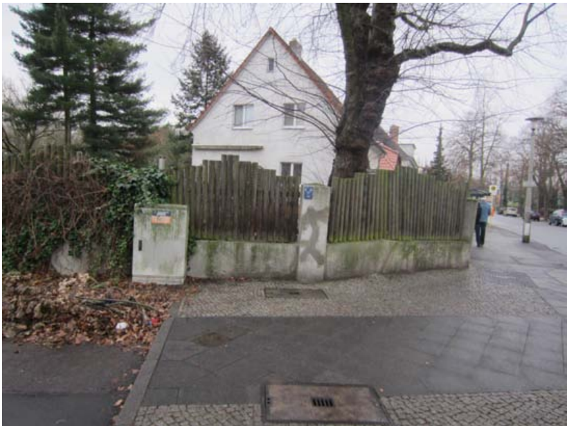
Einfamilienhäuser in Zone 2 der Köpenicker Allee