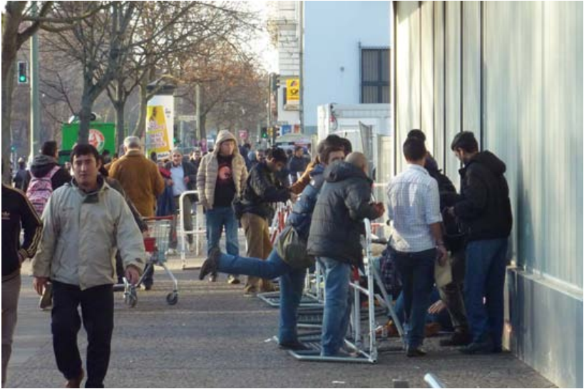
Wartende vor dem LaGeSo. Dezember 2015.

ten. Abbildung eins zeigt die Lage vor dem LaGeSo im Dezember 2015: Die Geflüchteten reichten sich schon früh am Tag in die Schlange ein, die sich vor dem Tor zum Innenhof des LaGeSos befand. Abgetrennt vom Bürgersteig durch Sicherheitszäune standen die Wartenden bis in den frühen Morgen hinein unter freiem Himmel. Oft waren mehrere Hundert Geflüchtete vor Ort. Das Tor zum LaGeSo -Gelände wurde um vier Uhr früh geöffnet, woraufhin die Menschen weiter auf dem Hof und in den wenigen Wartezelten auf den Einlass in das Hauptgebäude hofften. Da täglich zu viele Termine vergeben wurden, warteten die Geflüchteten oft mehrere Tage und Nächte hintereinander, um bei den Angestellten vorsprechen zu können. Hierdurch entstand eine große Sichtbarkeit, was manche Anwohner_innen berührte und sie zum Unterstützen bewegte, sodass zu vielen Tages- und Nachtzeiten Unterstützende vor Ort waren.