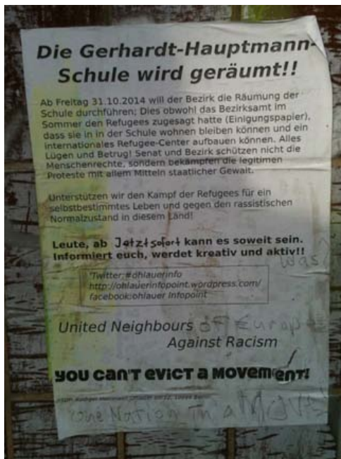
Abbildung 4: »United Neighbours Against Racism«

Kurzerhand beschloss ich, nicht nur statisch an der Ecke zu stehen, sondern einen eigenen Wahrnehmungsspaziergang zu machen, ausgerüstet mit