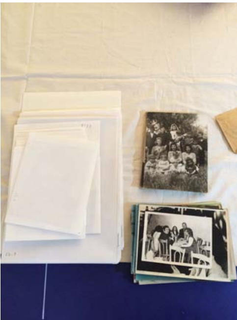
A.'s indexing system and unsorted photographs from family albums.