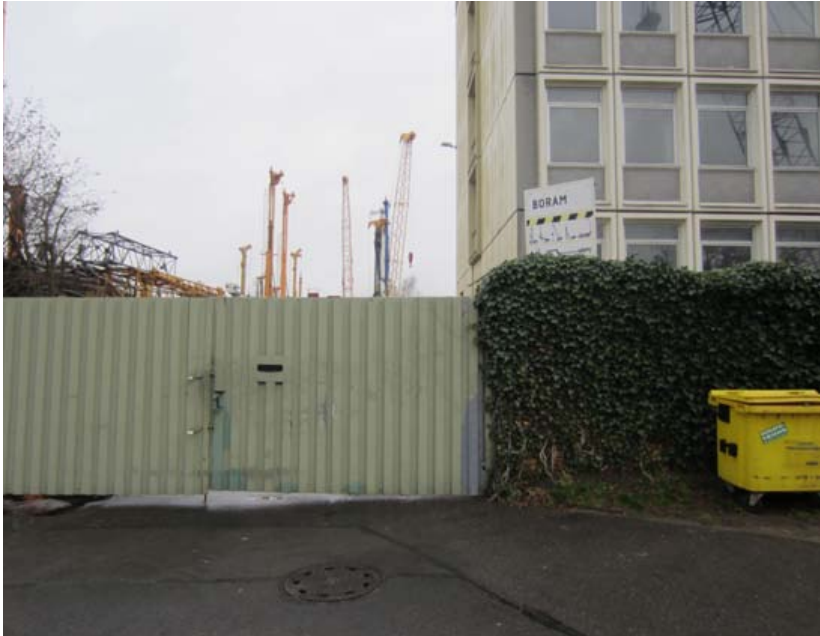
Zone 3 der Köpenicker Allee; Foto © Meret Eikenroth

»Die Erstellung eines ›fotografischen Rasters‹ [dient] als erster Schritt zu einer Feststellung von Veränderungen der gebauten Umwelt, die im Durchschreiten des Raums offenbar werden.« (Welz 1991, 56) Diese Methode stellt damit eigentlich einen explorativen Schritt in der ethnografischen Forschung dar; sie kann aber auch, wie in unserem Fall, in einem späteren Stadium der Forschung eine Ergänzung zu anderen Stadt-ethnografischen Methoden darstellen. Beim fotografischen Raster geht es darum, einen Querschnitt durch verschiedene Haus- und Gebäudetypen und Straßenbilder zu präsentieren, aber auch Grenzen und Brüche im Raum auffindig zu machen und zu lokalisieren und Brennpunkte zu ermitteln. In unserer Forschung diente dieses Mittel besonders der Veranschaulichung der sich verändernden Umwelt vom städtischen Raum hin zum peripheren Raum der Notunterkunft. Es ist zugleich der Versuch eines Einfangens der spezifischen Atmosphäre eines Raumes, für die Worte oft nicht ausreichen.