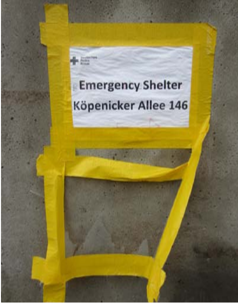
Zettel zur Notunterkunft