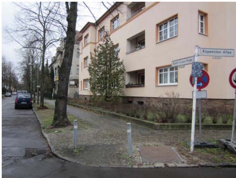
Wohnblöcke in Zone I der Köpenicker Allee