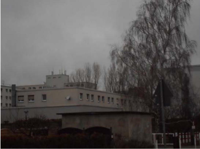
The shelter from the Eastside.

›impossibility‹ of access along with the strong impression that first visit had on us, led us to re-establish the surrounding area to the shelter as our research and experimentation field. Initially, it was disappointing for me. We had managed to somehow avoid finding ourselves in the situation I had argued to defend in the classroom! The question that concerned us thereafter was how to define and study the atmosphere of the area, which according to our experience was practically wasteland. At the centre of the analysis of that grim atmosphere was the awkwardness and discomfort we felt wandering at the surroundings. I couldn't stop thinking how much of my perception was determined by my own personal references that were probably extremely different if not opposite to those of my classmates.