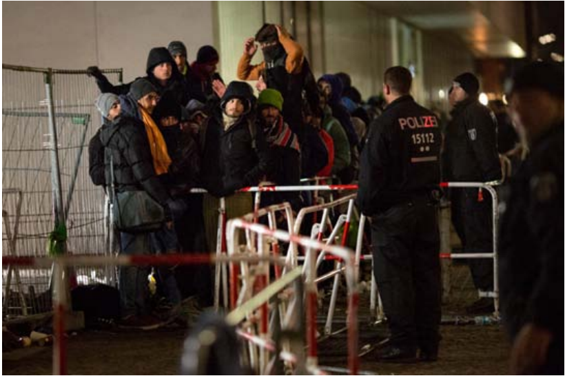
Wartende nachts vor dem LaGeSo Berlin. November 2015.