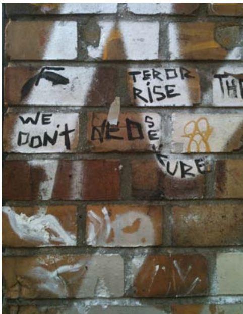
Abbildung 2: »We don't ned sekure« © Dženeta Hodžić

Seit dem Oranienplatz haben bundesweite Proteste gegen Asylpolitiken einen gemeinsamen geographischen Bezugspunkt. Der Platz symbolisiert somit mehr als nur die konkreten Proteste in Berlin: Er steht für die Forderung der Abschaffung der Lager- und Residenzpflicht und den Stopp der bestehenden Abschiebungspraktiken. Geflüchtete haben sich mit dem Oranienplatz einen sozialen Raum geschaffen, der sie auch weiterhin repräsentiert, obwohl das Protestcamp als wahrnehmbarer Ort verschwunden ist (Ataç 2015). Nachdem auf Anordnung des Berliner Senats im April 2014 der Oranienplatz gegen den Willen der dort zeltenden Geflüchteten, Bewohner_innen und Aktivist_innen polizeilich geräumt wurde, besetzten viele der von der Räumung betroffenen Personen aktiv als Intervention die Gerhart-Hauptmann-Schule in der Ohlauer Straße. So entstand mit Einfluss der früheren so genannten O-Platz-Proteste in der Schule ein selbstorganisierter Widerstand der Geflüchteten, mit dem sie die Abschaffung der Residenzpflicht, des Arbeitsverbots und einen freien Arbeitsmarktzugang sowie EU-weite Freizügigkeit (ein-)forderten. Im Juni 2014 verließen jedoch viele Bewohner_innen der Gerhart-Hauptmann-Schule das Gebäude, aufgrund der tagelangen Belagerung durch massives Polizeiaufgebot.