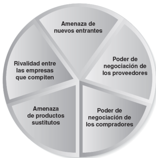
Figura 2.2 Modelo de competencia de cinco fuerzas. Una herramienta analítica clave. (Thompson et al., 2012, pág. 55).

La intensidad de la competencia en el sector industrial y su potencial para las utilidades están en función de las cinco fuerzas de la competencia: las amenazas que plantean las nuevas empresas entrantes, el poder de los proveedores, el poder de los compradores, los productos sustitutos y la intensidad de la rivalidad entre los competidores. (Hitt et al., 2008, pág. 51).