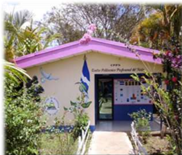
Tecnológico Nacional Agropecuario de Jalapa

Jalapa es considerada una ciudad muy productiva por contar con terrenos fértiles. Constituye uno de los pilares de la economía, y por eso es necesario formar, Técnicas/os Agropecuarias/os; Veterinarias/os y Técnicos en Administración Agropecuaria, con principios y valores que le permitan convivir en armonía con la sociedad y el ambiente,