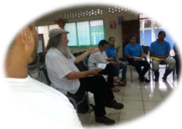
Ilustración: 4, Docentes participando en dinámica de cooperación genuina realizada por el facilitador Herman Van de Velde.