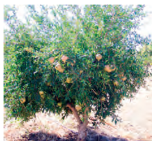
Fig. 2 - Árvore da cultivar Mollar de Elche.