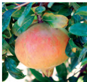
Fig. 5 - Fruto da cultivar Molar de Játiva.

qualidade necessária para competir com os frutos provenientes de Espanha, que apresentam um bom calibre e uma boa apresentação e têm vindo a conquistar gradualmente o consumidor nacional (Anuário Vegetal, 2006).