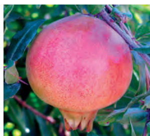
Fig. 3 - Fruto da cultivar Mollar de Elche.