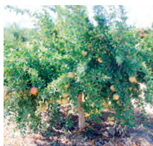
Fig. 4 - Árvore da cultivar Mollar de Játiva.