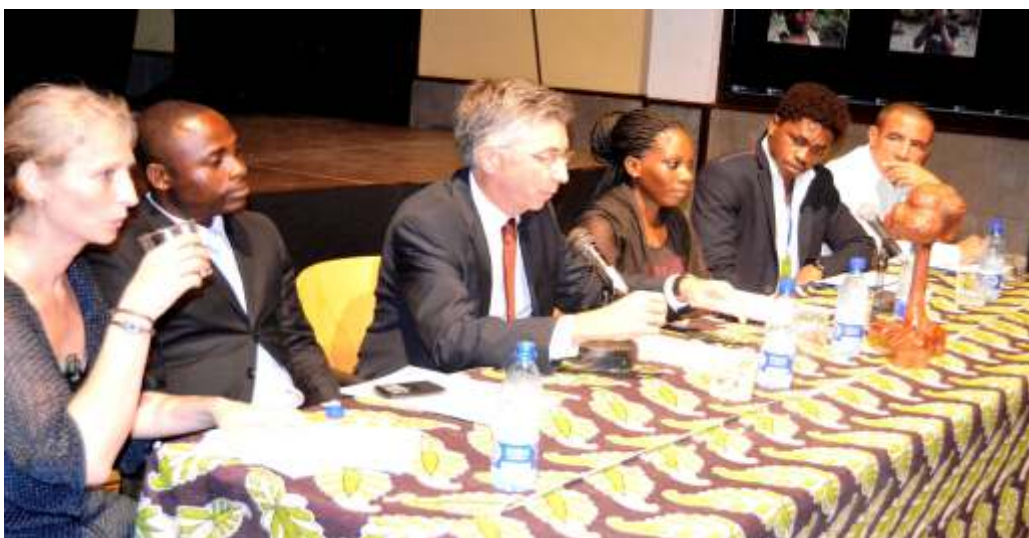
Mesa inaugural de FECIGE: Directora del CCEM, Inspector General de Cultura y Turismo, Embajador de España en Guinea Ecuatorial, Representante del CCEG, Presidente de ACIGE, Responsable de la cooperación educativa de Cuba.