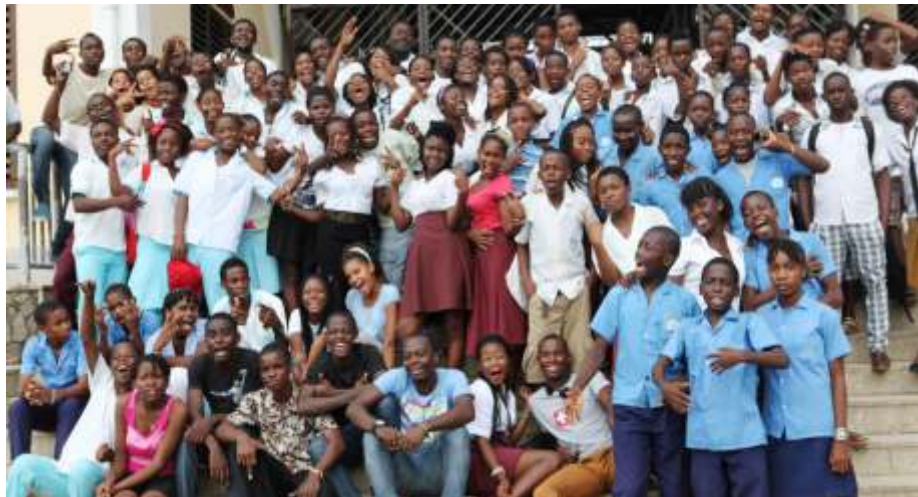
Alumnos/as participantes en la pasada edición del festival

Del 24 al 29 de junio el teatro escolar inundará de nuevo las tardes de la ciudad de Bata. Vuelve renovado y reforzado el Segundo Festival de Teatro Escolar "Ciudad de Bata" organizado en colaboración con la Asociación "Actores del Milenio".