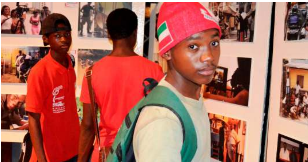
Exposición fotográfica "Guinea Rueda" con imágenes de rodajes que han tenido lugar en Guinea en los últimos años.