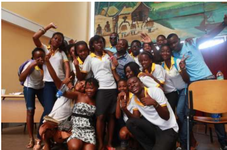
Alumnos/as del colegio Eco de futuro, tras su victoria el 27 de abril en Bata

En el mes de enero el CCEB envió a los centros escolares participantes una selección de diez clásicos de la literatura fantástica y de terror. El concurso valora la comprensión lectora de los alumnos y premió a aquellos que fueron capaces de contestar correctamente al mayor número de preguntas sobre las obras.