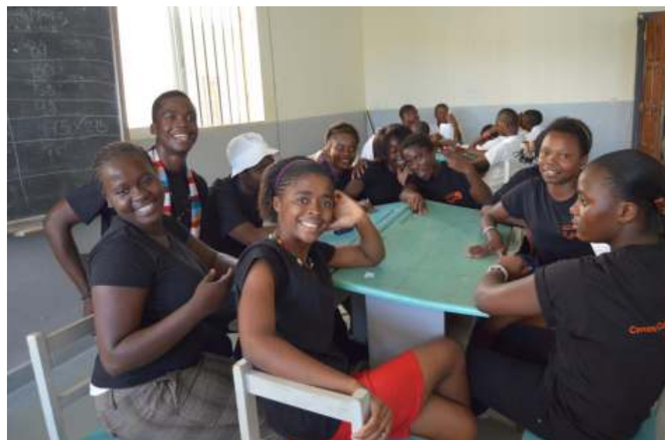
Chicos/as del INES de Mongomo en la final del Concurso en la Región Continental el 4 de mayo