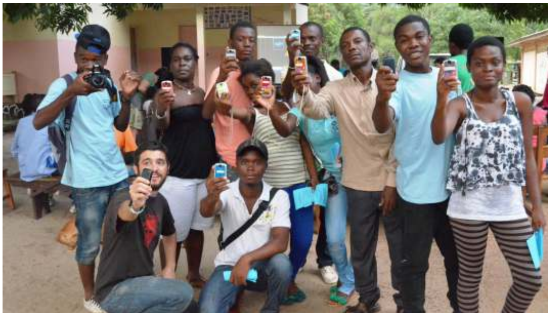
Grupo de alumnos/as del taller de realización audiovisual básica desarrollado durante el FECIGE en Bata