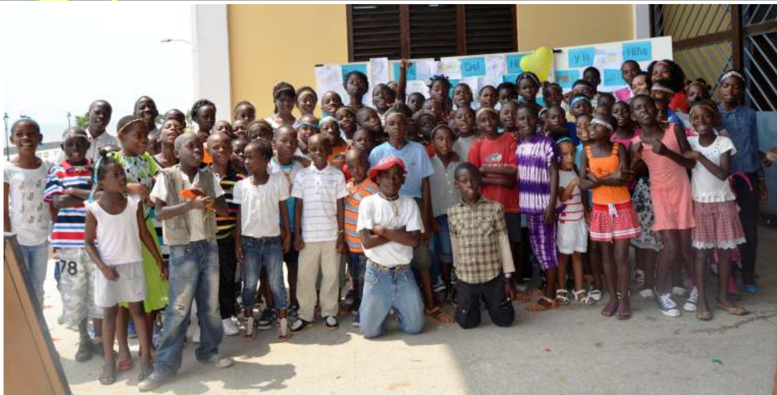
Más de cien niños participaron en la celebración del Día del Niño Africano el 15 de junio

El 16 de junio de 1976 en Soweto (Sudáfrica) miles de escolares negros se manifestaron para protestar por la inferior calidad de su educación y para reclamar su derecho a ser educados en su propia lengua. La represión de las autoridades sudafricanas fue brutal y cientos de niños y jóvenes fueron asesinados.