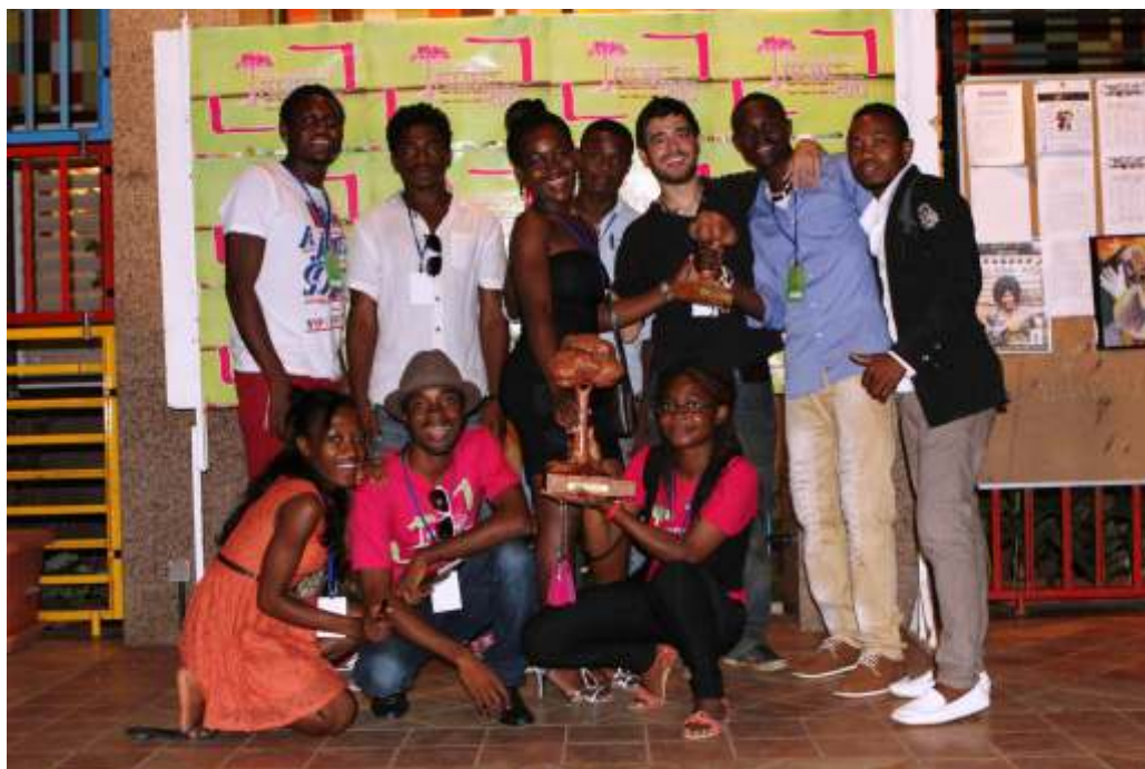
Miembros de ACIGE sosteniendo el Premio Ceiba del jurado premio al mejor cortometraje, que fue para "Lámpara"

Conscientes del importante valor sensibilizador del cine, esta nueva edición del FECIGE incluyó la sección especial "Salud y Medio ambiente" en la que se proyectarán varios cortometrajes de sensibilización sobre el VIH, la salud mental y la conservación de la biodiversidad en Guinea Ecuatorial.