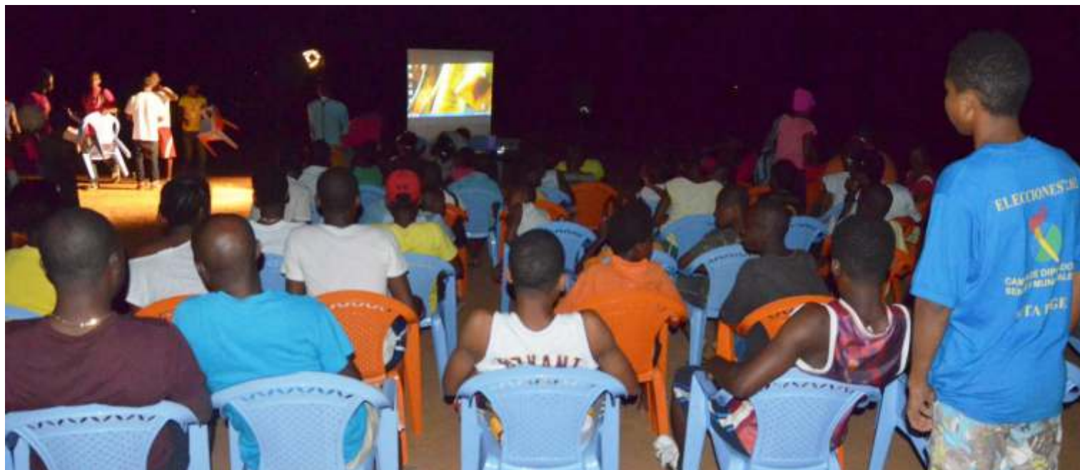
Proyección del FECIGE en el Campo de la Salle en Lea ( Bata)

Del 6 al 15 de junio, las plazas, calles, colegios y centros culturales de Guinea Ecuatorial se llenaron de cine. Del mejor cine ecuatoguineano, africano e iberoamericano actual. Volvía mejorado y ampliado, el FECIGE, la cita anual más destacada del sector audiovisual en el país.