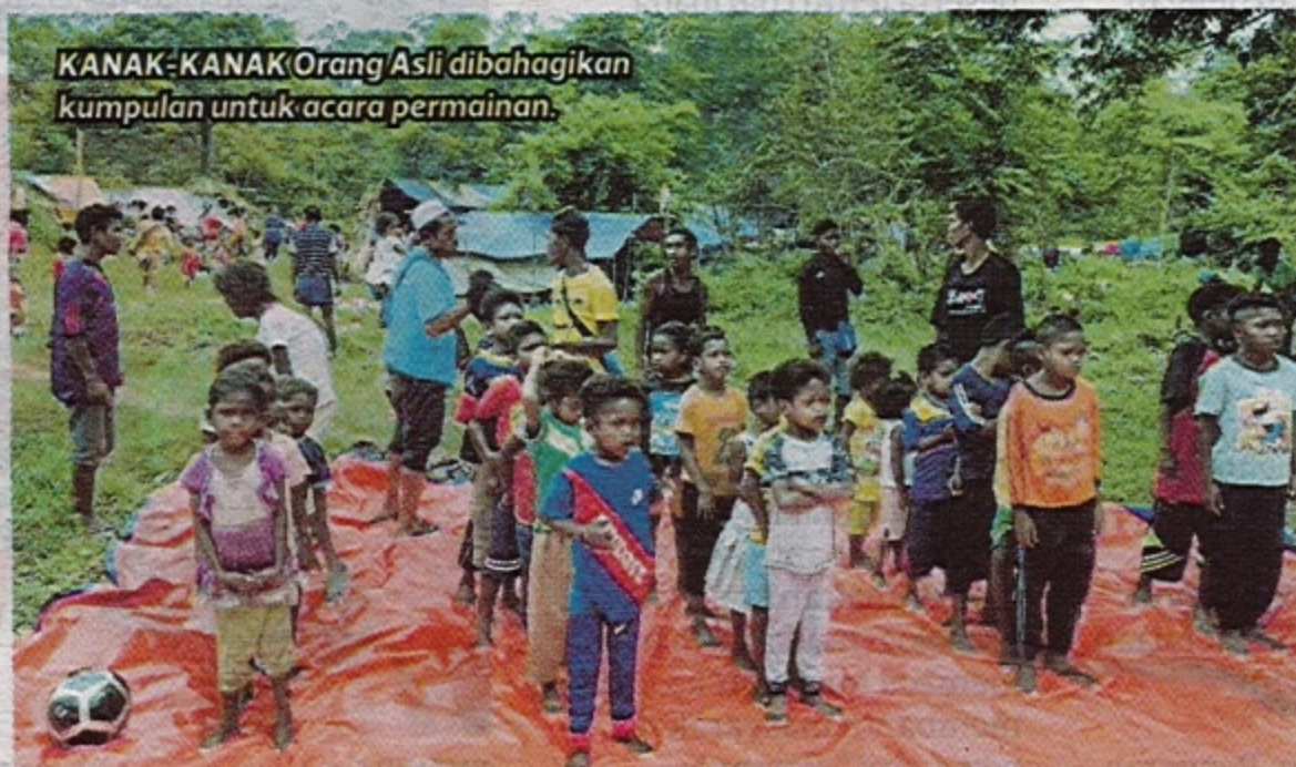
KANAK-KANAK Orang Asli dibahagikan kumpulan untuk acara permainan.

Menurutnya, banyak perancangan dakwah disusun untuk tahun depan. Mulai Januari mereka akan ke Bera, Pahang, Pulau Banggi, Sabah dan Ulu Tembeling sekali lagi yang pasti memerlukan dana terutama dakwah bil hal yang berbentuk memberi bantuan material.