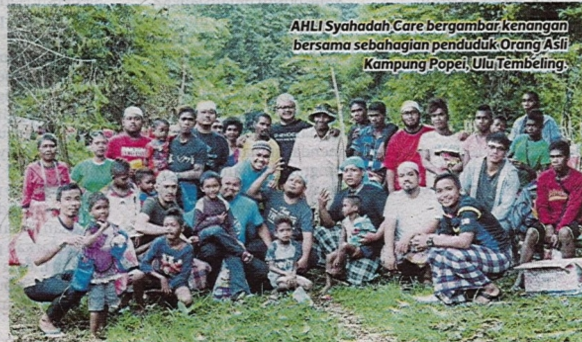
AHLI Syahadah Care bergambar kenangan bersama sebahagian penduduk Orang Asli Kampung Popei, Ulu Tembeling.