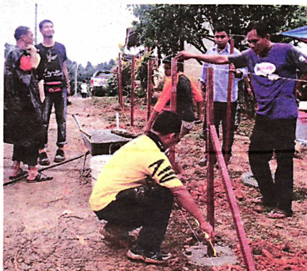
PAGAR surau turut dibina bagi mengelakkan dimasuki anjing liar.