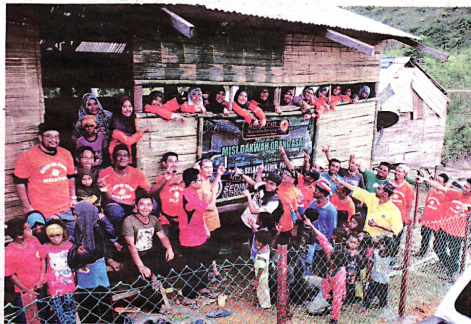
SERAMAI 35 sukarelawan Muslim Care Malaysia berjaya membina surau baharu di Perkampungan Orang Asli Kampung Selaor, Gerik.

Sukarelawan melalui trek lori balak menempuh pelbagai halangan seperti jalan berbukit, licin dan berbatu selain terpaksa mengharungi anak sungai