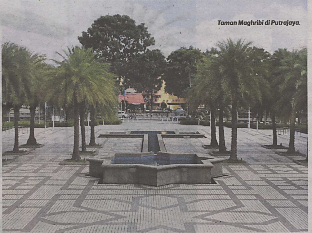
Taman Maghribi di Putrajaya.