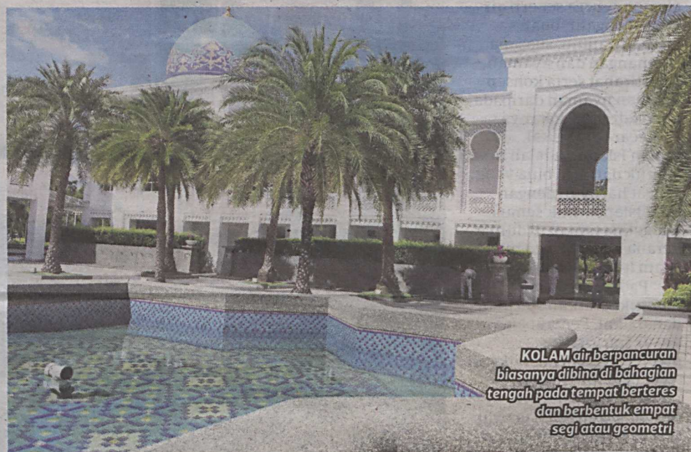
KOLAM air, berpancuran biasanya dibina di bahagian tengah pada tempat berteres dan berbentuk empat segi atau geometri

Andalusia di Istana Alhambra, Andalusia, Generalife dan Granada.