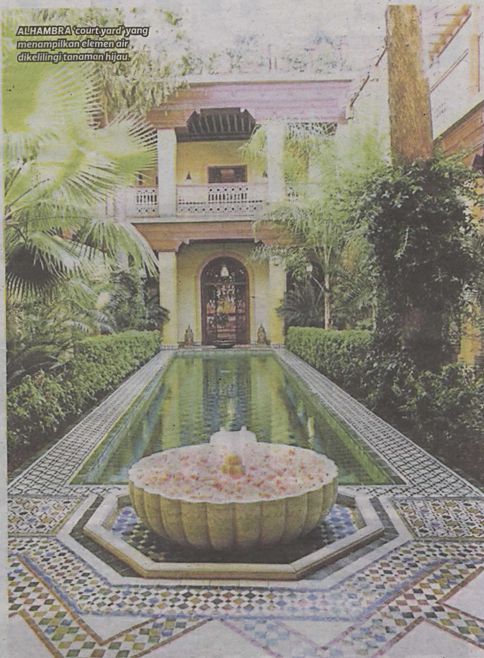
ALHAMBRA 'courtyard' yang menampilkan elemen air dikelilingi tanaman hijau.

Pada abad ke-14, taman Islamik yang dibangunkan dipengaruhi oleh ciri seni bina Moorish dan berteknologi di bahagian selatan Sepanyol terkenal sebagai taman