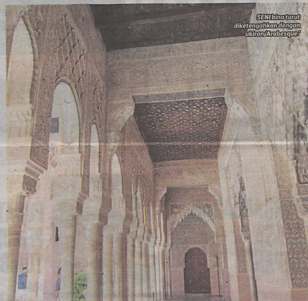
SENI bina turut diketengahkan dengan ukiran 'Arabesque'.