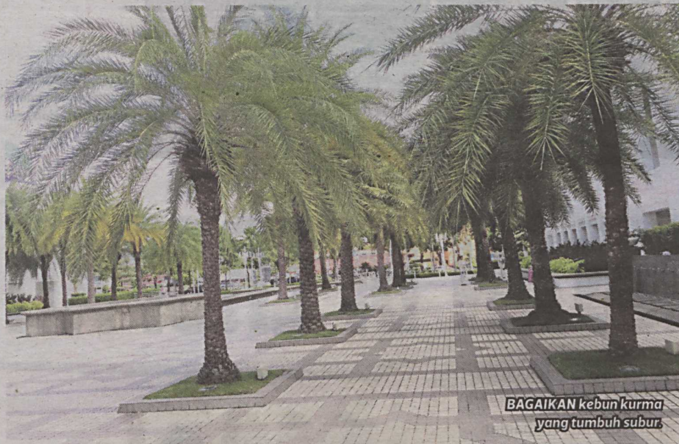
BAGAIKAN kebun kurma yang tumbuh subur.