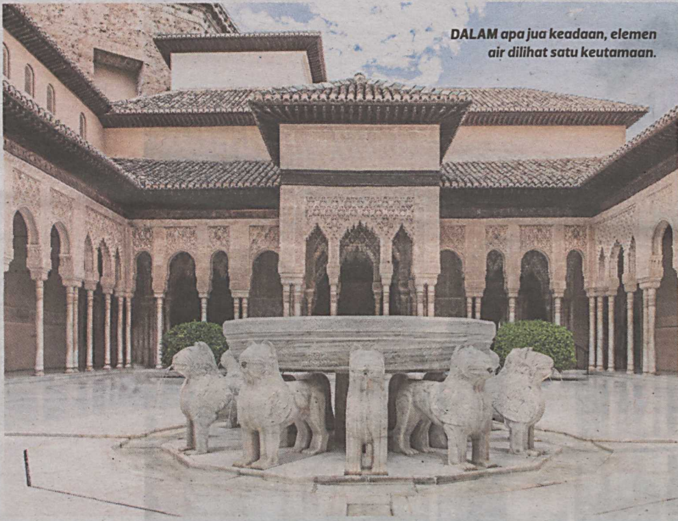
DALAM apa jua keadaan, elemen air dilihat satu keutamaan.