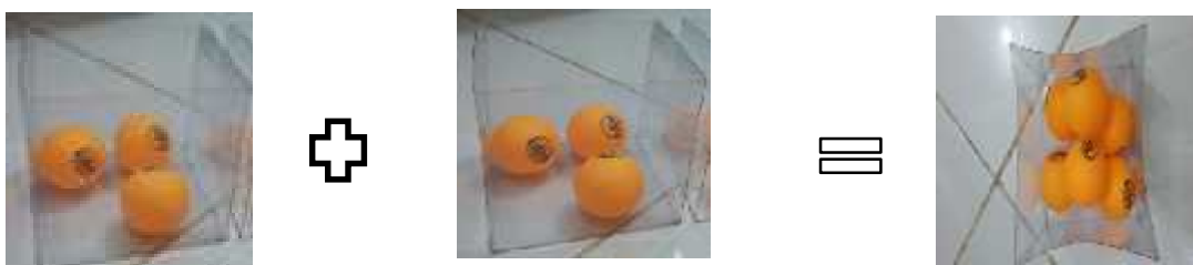
Gambar 2. Arti dari 2 \times 3

3 \times 2 , artinya terdapat 2 kotak dimana masing-masing kotak berisi 3 bola. Yang terlihat seperti pada gambar dibawah ini .