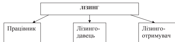
Рис. 2. Класична схема лізингу

Лізинг – це специфічна форма оренди робочої сили, яка передбачає надання лізингодавцем лізингоотримувачу робочої сили у тимчасове користування.