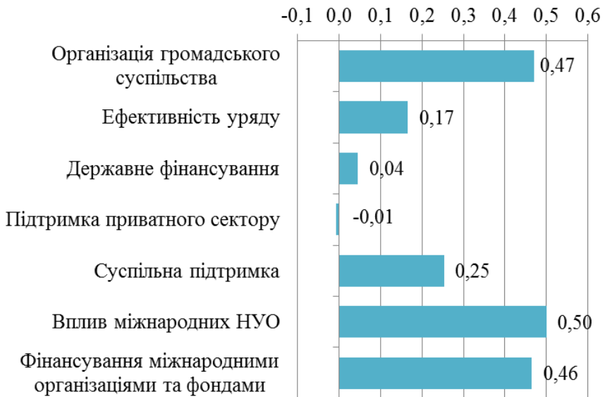
Рис.3. Значення узагальнених коефіцієнтів зворотного зв'язку організації громадянського суспільства в Україні в когнітивній моделі

міжнародних НУО», на підставі чого можна стверджувати, що громадське суспільство в Україні розвивається завдяки впливу міжнародних організацій. Практично такий самий вплив мають фактори «Організація громадянського суспільства» та «Фінансування міжнародними організаціями та фондами». Значення цільового фактору «Організації громадянського суспільства в Україні» і говорить про те, що громадське суспільство активно розвивається. Значення фактору «Фінансування міжнародними організаціями та фондами» говорить про те, що організації громадянського суспільства в основному розвиваються за рахунок не просто недержавних, а зовнішніх дотацій. При чому зовнішній вплив значно більший ніж з боку громадськості України.