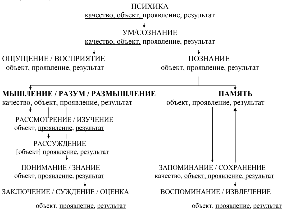
Схема 3. Структура прототипической категории ИНТЕЛЛЕКТУАЛЬНАЯ ДЕЯТЕЛЬНОСТЬ (основа – концептуальная схема категории)

С учетом того, какой из понятийных аспектов парцелл в наибольшей степени выделен с помощью языковых единиц, концептуальная схема категории ИНТЕЛЛЕКТУАЛЬНАЯ ДЕЯТЕЛЬНОСТЬ принимает следующий вид (схема 3).