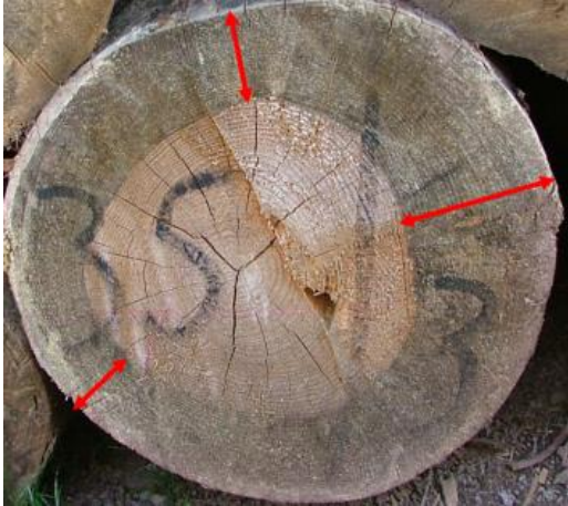
Şekil 1. Enine kesitte hasarlı dış halkanın ölçümü.

Şekil 1'de görüldüğü üzere hasarlı dış halka genişliği üç farklı yerden yapılan ölçümle belirlenmiş (Anonim 2001), ardından elde edilen ortalama dış halka genişlikleri kullanılarak her bir tomruktaki hasarlı odun hacmi ve istifteki toplam hasarlı odun hacmi (THH) hesaplanmıştır.