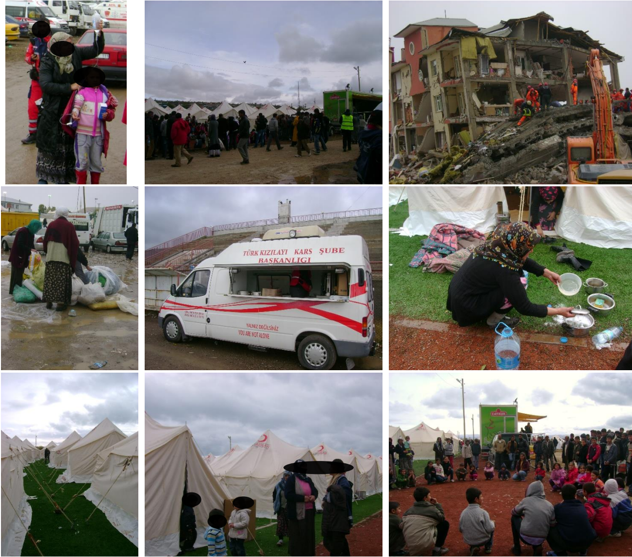
Şekil 3: Van depreminden görüntüler