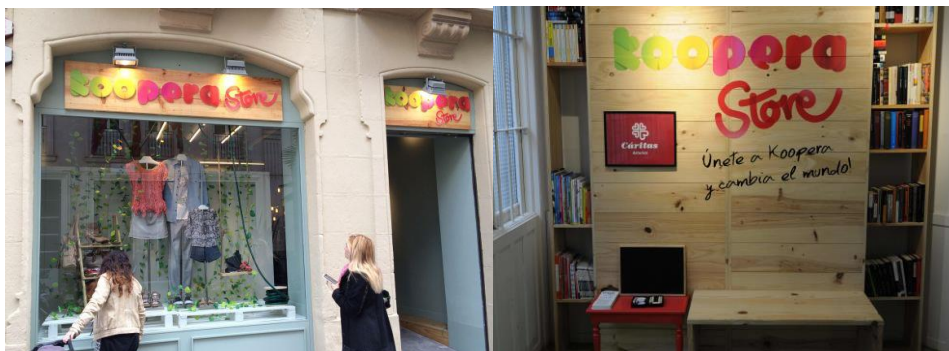
Fotografías 3 y 4. Tiendas Koopera en Oviedo y Gijón.

El trabajo desarrollado durante las prácticas en la organización consistió en el apoyo al departamento de Cooperación al Desarrollo en la elaboración e implementación de un plan de sensibilización sobre la Economía Solidaria, haciendo especial énfasis en el Consumo Responsable, el Comercio Justo y las Empresas de Inserción Social; temáticas que han cobrado fuerza en la organización a nivel regional; especialmente tras la apertura de dos tiendas Koopera en la provincia (Oviedo y Gijón).