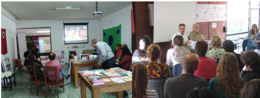
Fotografías 1 y 2. Ponencias en el encuentro confederal de Cooperación Internacional de Cáritas.

Para profundizar en el enfoque de Cáritas en estas temáticas, se asistió al encuentro anual confederal de Cooperación Internacional de Cáritas; donde, en diferentes ponencias, se expusieron las experiencias de la organización con estas iniciativas en diferentes países.