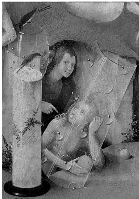
Fig. 5. El Bosco, Detalle, El jardín de las delicias, 1505-1515.

La mujer va a ser la gran perdedora de la transformación del pecado original en pecado sexual. El motivo deriva de la insistencia en la maldad intrínseca del goce sexual y el desprecio sin paliativos por lo carnal que se manifiesta en una serie de tratadistas que tenían como fin la búsqueda y consecuentemente el hallazgo de un impulsor o culpable, un ser proclive al pecado que no podía ser aquel hombre creado a semejanza de Dios, por tanto la lógica patrística reparó en Eva, o lo que es lo mismo, en la mujer.