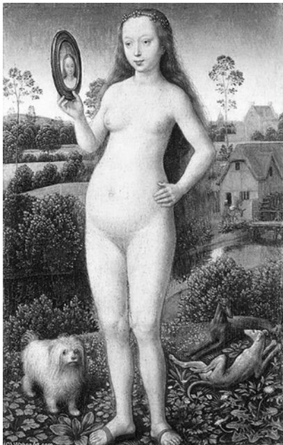
Fig. 1. Memling, La vanidad (Tríptico de la vanidad terrestre y la redención celestial), 1490.

Un ejemplo plástico lo hallamos en un detalle del Tríptico de la vanidad terrestre y la redención celestial (Fig. 1) de Hans Memling (1490, Strasbourg: Museo de BB.AA). La obra recrea un discurso sobre la caída del género humano en la perversión moral. Una figura femenina está consumando el pecado de la soberbia al estar observándose en un espejo. En la misma pintura, se desarrollan otros paneles que otorgan aún más sentido al panel de la soberbia. Se encuen-