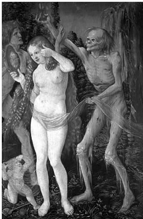
Fig. 4. Hans Baldung, Los dos amantes y la muerte , 1510.

La obra de Hans Baldung denominada Los dos amantes y la muerte (1510, Viena: Kunsthistorisches Museum) donde una mujer se contempla en el espejo personificando así el pecado de la soberbia y estableciendo una clara referencia al acicalamiento y aderezo personal tan condenado por la literatura moralizante cristiana. La mujer, de gran belleza, desnuda y de extenso cabello hace que la obra obtenga grandes dotes de erotismo y sensualidad, más aún cuando un fino velo transparente es el único elemento que cubre su pubis y que es sostenido por un esqueleto que se encuentra justo a su lado mostrándole a la joven un reloj de arena. El esqueleto como símbolo de la muerte fue acuñado en el arte de la Edad Media, adquiriendo especial relevancia durante el Renacimiento (Tervarent, 2002: 243). Dicha figura