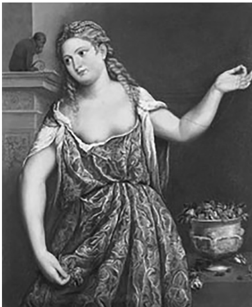
Fig. 3. Paris Bordone, Retrato de una joven , 1543-1550.