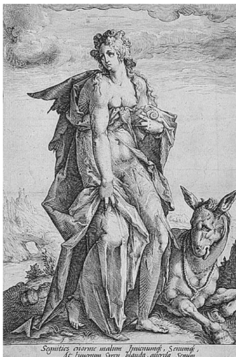
Fig. 6. Jacob Matham, La Acidia , s. XVII.

Con este mismo propósito, el poeta francés del s. XV Alain Chartier se refiere a la melancolía con las siguientes palabras: «Y más tarde supe que aquella vieja se llamaba Melancolía, que confunde el pensamiento, seca el cuerpo, envenena los humores, debilita las percepciones y conduce a los hombres a la enfermedad y a la muerte» (Peñalver Alhambra, 1999: 78). La literatura moralizante del Medioevo determinó el temperamento melancólico como la causa principal del cometimiento pecaminoso de la pereza, argumentando que el ser melancólico es aquel que constantemente anhela un deseo que no alberga, provocando consecuentemente una tristeza incontrolada que desemboca en la inactividad física, conformando de esta forma el pecado de la acidia o pereza. Un ejemplo de este vínculo emocional, lo hallamos en la obra de Jacob Matham de principios del s. XVII titulada Acidia . En ella se observa a una mujer de mirada perdida, impertérrita y ausente del mundo que le rodea, cabello astroso y harapiento ropaje. A su lado, un asno se encuentra tendido con rostro de gran senectud y mirada desorientada y aturdida (Fig. 6).