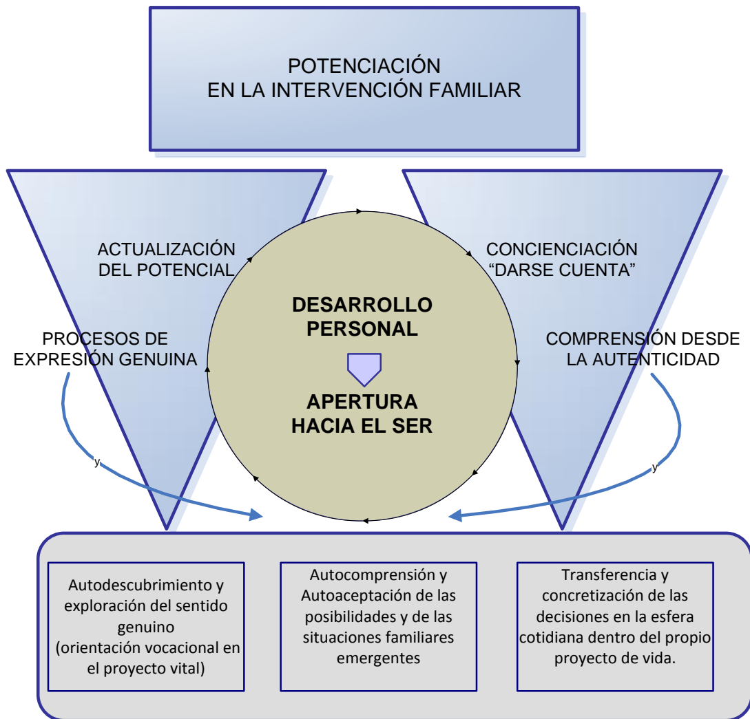
Figura 1. Potenciación y desarrollo personal en la intervención familiar

De este modo la potenciación y desarrollo personal se asienta en el concepto de relación de ayuda, como un tipo de relación con el paciente (la persona demandante) que tiende a la ayuda y está centrada en la persona y no sencillamente en el problema, lo que implica una actitud facilitadora y no directiva o autoritaria. Este proceso de crecimiento y desarrollo personal permite abrirse a la realidad, explorarla, desde la activación de las propias energías, el propio “curador interno” que influye sobre la salud global de toda la persona. La conexión inevitable de la relación de ayuda con el desarrollo personal requiere necesariamente de unas condiciones específicas que evocan en la persona la posibilidad de “darse cuenta” (concienciación) de su propia naturaleza completa y plena, así como del sentido propio en su proyecto vital.