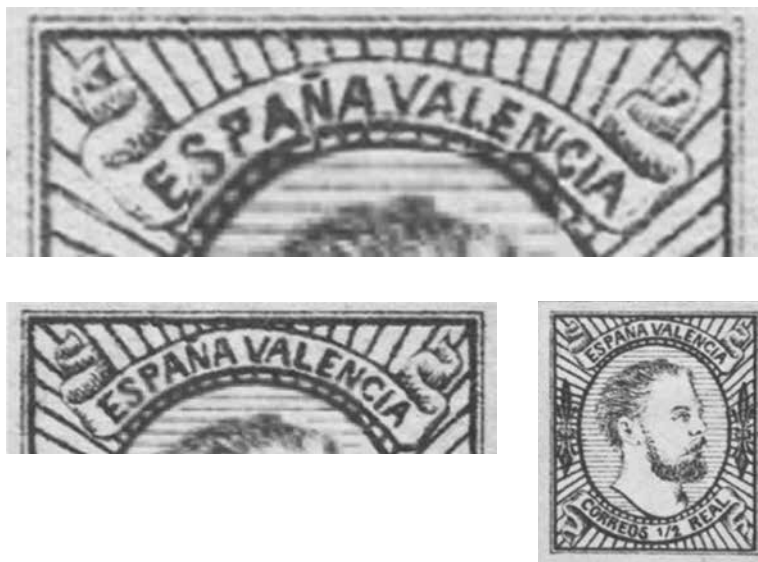
Fig.- 3. El "sello mellizo". (Detalles). Catálogo Gálvez, 1960.

cidas. Se deben, supuestamente, a la voluntad creadora de su grabador, Juan Vilás, ex-oficial carlista y responsable del taller litográfico de Vistabella, luego trasladado a Villahermosa, la única que había en todo el territorio dominado por los carlistas del Maestrazgo.