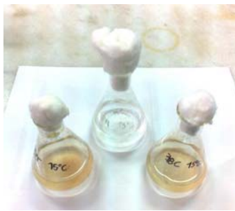
Figura 1. Degradación de fenantreno en medio líquido. Los ensayos se realizaron en cultivos en MML suplementado con 2000 mg/L de fenantreno como única fuente de carbono y energía. La coloración del medio evidencia la acumulación de productos parciales de oxidación de dicho PAH y permite la selección de cultivos degradadores.

La capacidad de degradación se evaluó en MML suplementado con 2000 mg/L fenantreno. La acumulación de productos parciales de la oxidación de fenantreno lleva a la coloración del medio en tonos ocres y permite así evidenciar cualitativamente su degradación (Figura 1). A partir de este ensayo se seleccionaron 5 cultivos efectivamente degradadores de fenantreno. Dos de ellos fueron aislados del suelo de La Plata, donde el cambio de coloración se detectó a los 5 días de incubación. Los tres restantes fueron aislados antárticos y en los que se observó coloración luego de 3 días de incubación.